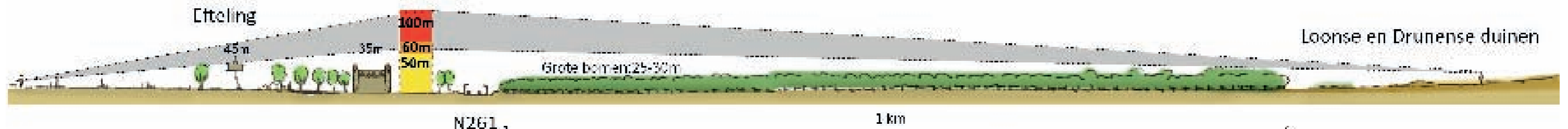
Figuur 3: Doorsnede en zichtlijnen uitbreiding Efteling

Naast de hoogte speelt de massa en materialisatie van de uitbreiding een belangrijke rol. Op de hoogtelijn (figuur 1) is zichtbaar wat de proporties van verschillende typen bebouwing visueel kunnen betekenen. Een slanke, transparante constructie kan subtieler in de omgeving op gaan dan een logge dichte massa. Kleurgebruik speelt hierbij ook een belangrijke rol. Het gebied staat bekend om de Efteling, dus een hoogte accent van 50 meter aan de N261 vormt een verbijzondering in de omgeving en zal een herkenbare landmark voor Kaatsheuvel zijn (zie figuur 2).