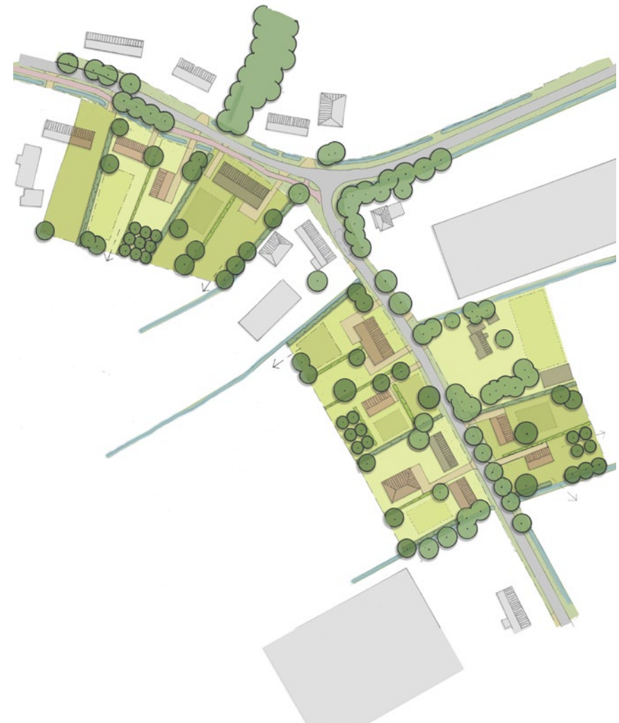
Mogelijke uitwerking minimale landschappelijke inpassing