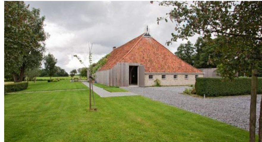
Voorbeeld grastuin met hagen

Buiten de 'tuin' met woonbestemming zijn er mogelijkheden om de ruimte achter de kavel in te richten met een (semi-) agrarische functie gerelateerd aan de woonfunctie. Dit kan een fruitboomgaard zijn of een dierenweide. Deze worden eventueel omzoomd door een afrastering met houten paaltjes of een inheemse haag van beuk of meidoorn.