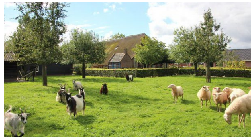
Voorbeeld (dieren)weide met fruitbomen