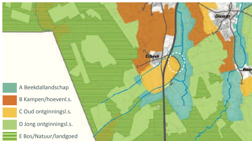
Ontwerp-Wijzer: uitsnede overzichtskaart Landschapstypen Gemeente Hilvarenbeek

Aan de Groenstraat 10-18 worden 13 woonkavels ontwikkeld. In het stedenbouwkundig plan en het beeldkwaliteitsplan van de Groenstraat 10-18 in Esbeek (juli 2018) is een integrale onderbouwing en planbeschrijving opgenomen voor zowel de uitwerking van de bebouwing als de landschappelijke inpassing. Dit document is hier een uitwerking van. Het beschrijft concreet de gewenste landschappelijke inpassing waar iedere bewoner - bij inrichting en aanplant van de kavel - aan dient te voldoen.