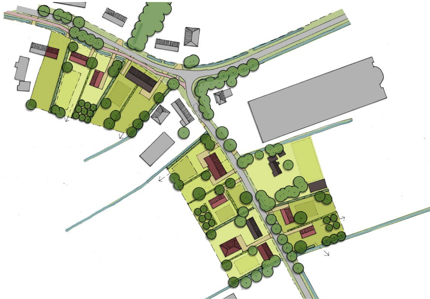
Indicatieve inrichtingschets uit het beeldkwaliteitsplan Groenstraat 10-18 (oktober 2018)