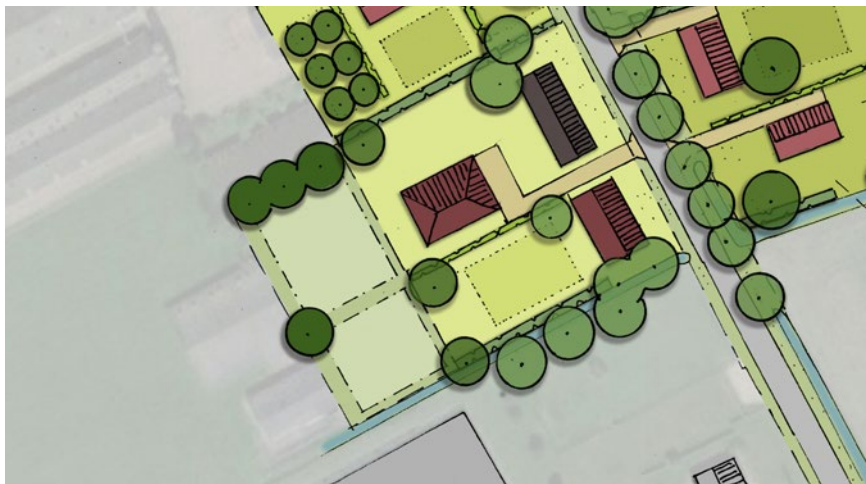
Mogelijkheid voor kleinschalige dierenweide / moestuin / boomgaard etc.