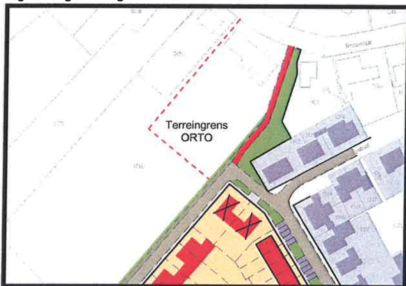
Figuur 3 globale grens van Orto Bouwmachines

De activiteiten vallen in ieder geval onder het Besluit Algemene Regels Inrichtingen Milieubeheer (BARIM) en ten aanzien daarvan gelden de volgende voorschriften voor geluid: