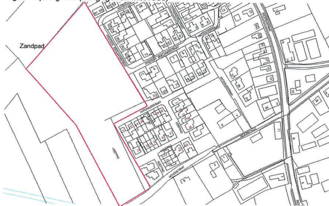
Figuur 1 plangrens (aangegeven met rood)

Het plangebied wordt ingevuld zoals aangegeven in figuur 2. Om de randvoorwaarden voor het stedenbouwkundig ontwerp inzichtelijk te maken, worden in dit rapport de milieu aspecten lucht en akoestiek nader bekeken. Op basis van de uitgave "Bedrijven en Milieuzonering" (VNG 2009) is de milieuzonering vastgesteld. Een geuronderzoek wordt apart uitgevoerd om deze reden is dit milieuaspect niet meegenomen in bijgaande milieuzonering