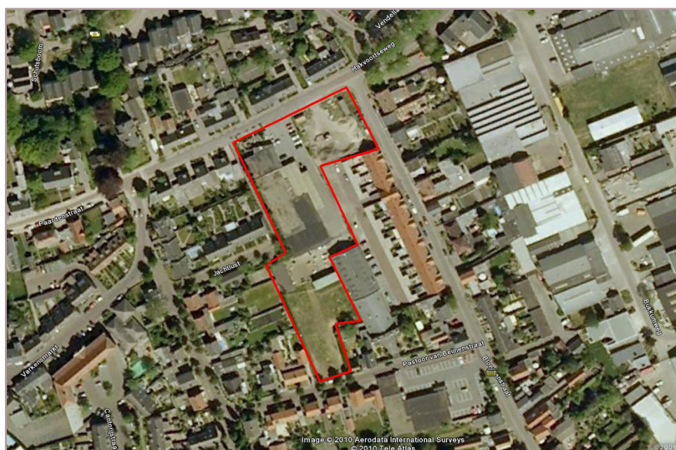
Figuur 1 Globale be- grenzing van het plangebied (rood) op een luchtfoto van Google Earth.

Het plangebied Paardenstraat (figuur 1) ligt binnen de kern van Hilvarenbeek, in de gelijknamige gemeente. Het plangebied omvat een paardenwei, een grasveld en een terrein met een winkel-pand met enkele opstallen en een verhard terrein.