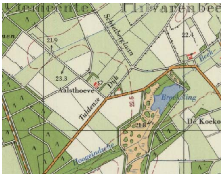
Situatie 1967. Topografische kaart 1967, kaartnummer 50H