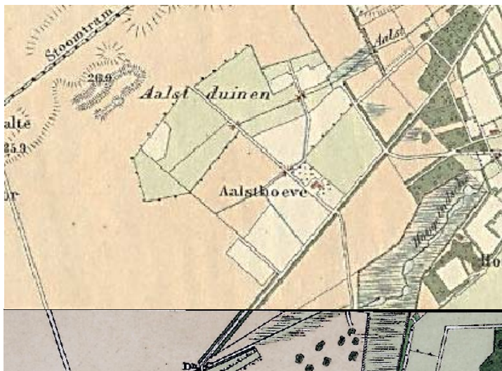
Situatie 1918. Topografische Militaire Kaart 1918.