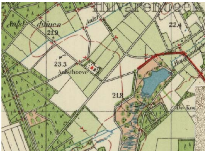
Situatie 1951, Topografische Kaart 1951, kaartnummer 50H