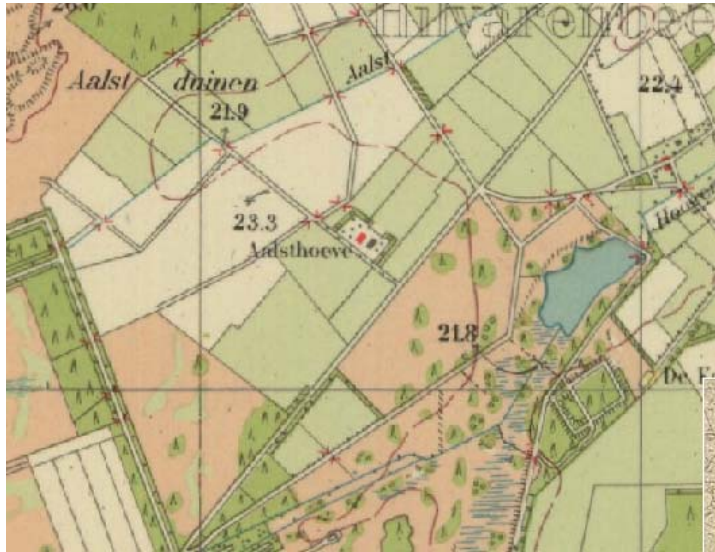
Topografische Kaart 1940