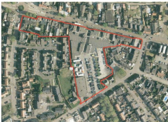
Weergave ligging en begrenzing van het plangebied