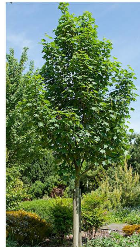
A: Acer pseudoplatanus 'Brucchem'