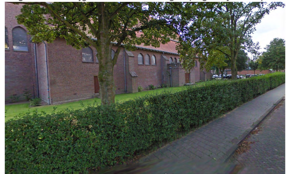
B: Middelhoge bestaande ligusterhaag als collectieve begrenzing kerktuin handhaven en waar nodig herstellen