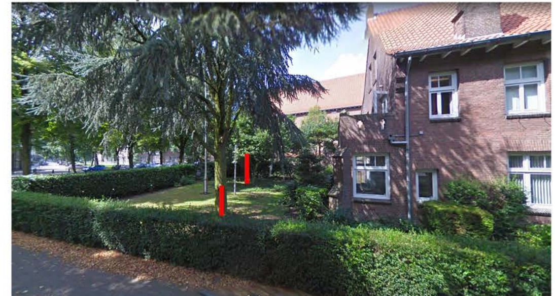
C: Cedrus libanii en D: Magnolia soulangeana