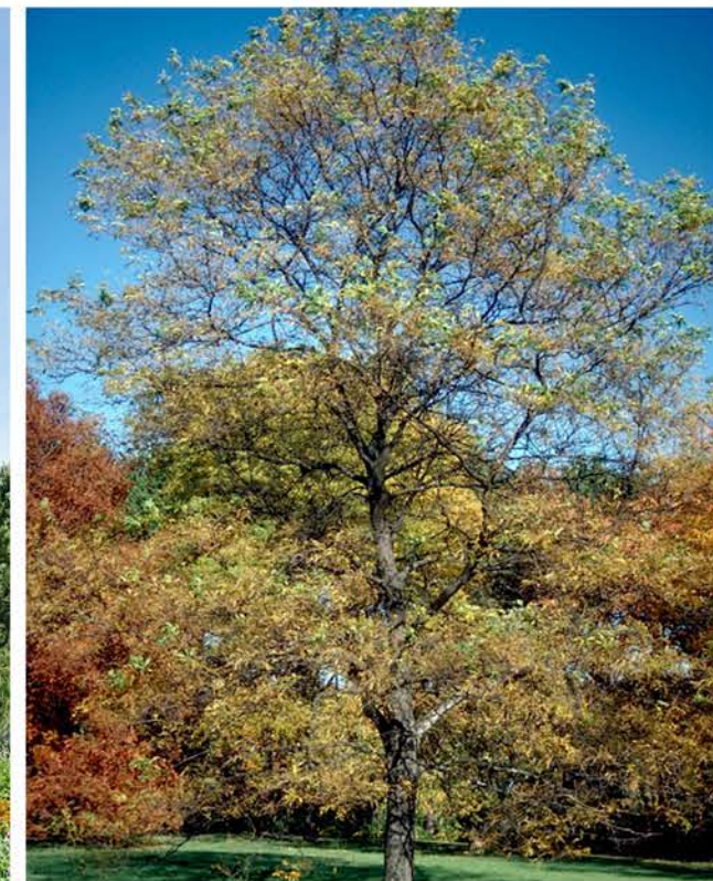
C: Gleditsia triacanthos 'Imperial'