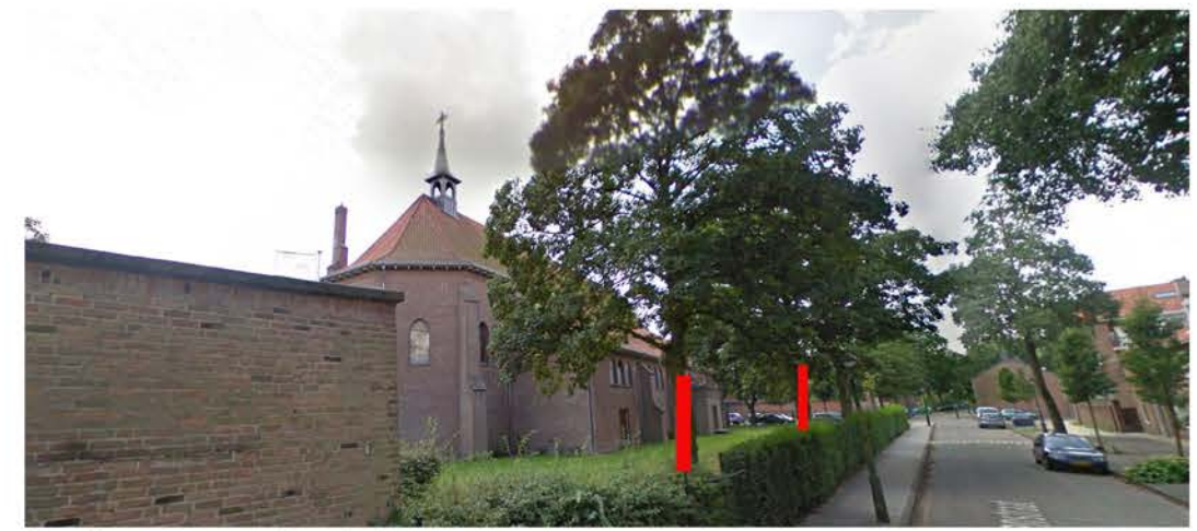
A: Acer pseudoplatanus