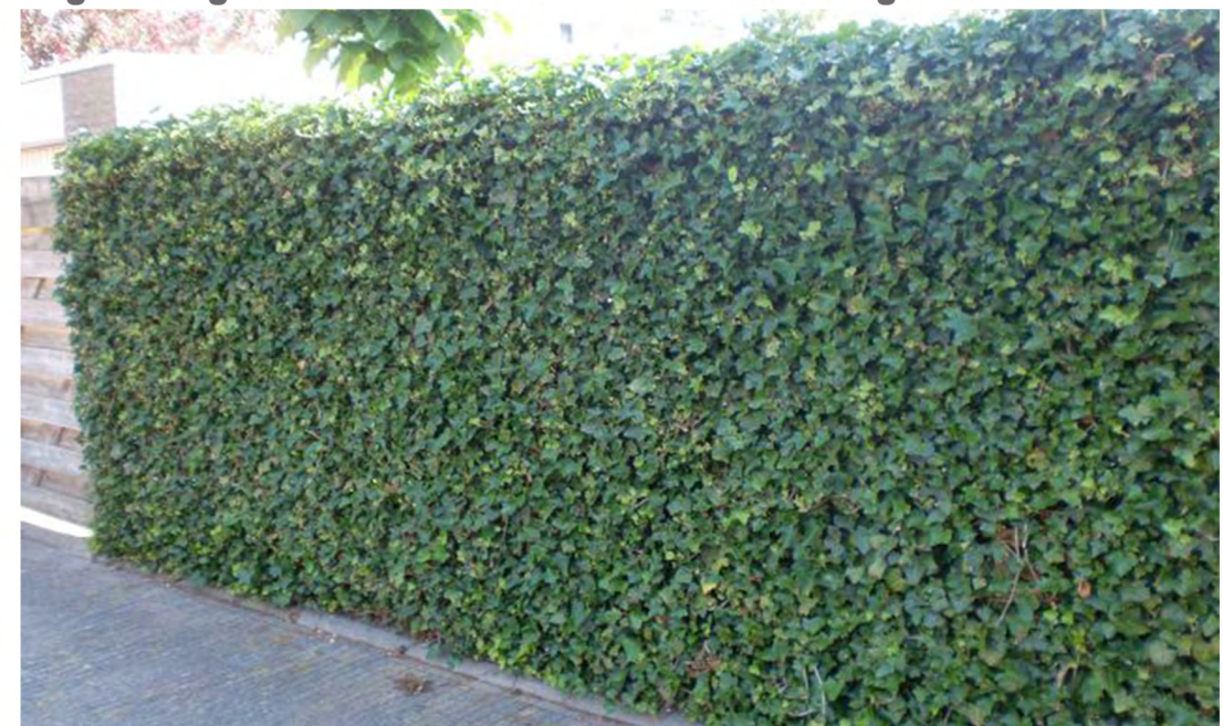
C: Begroeid hekwerk max. 2.00 m hoog als wintergroene perceelsscheiding ( Hedera hibernica )