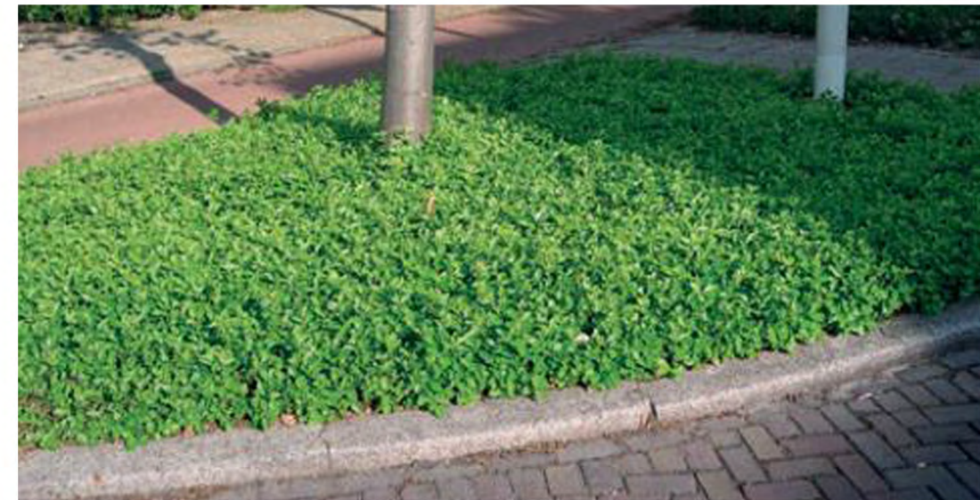
B: Wintergroene halfheester als eenduidige randbeplanting onder bestaande lindebomen en voor entreeplein. ( Euonymus fortunei 'Winterpride'), max. 0,40 m hoog