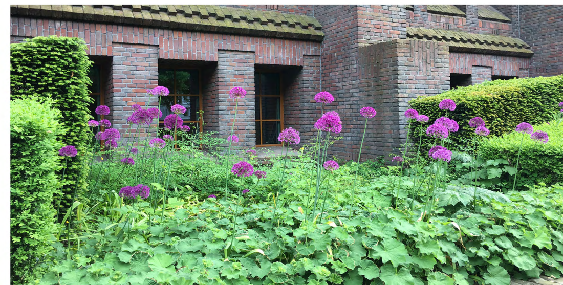
C: Vaste plantentuin. Wintergroene bodembedekkers, diverse bloeiende vaste planten en bollen. Mogelijk ontwikkeling van een 'Bijbelse Plantentuin' als verwijzing naar historie.