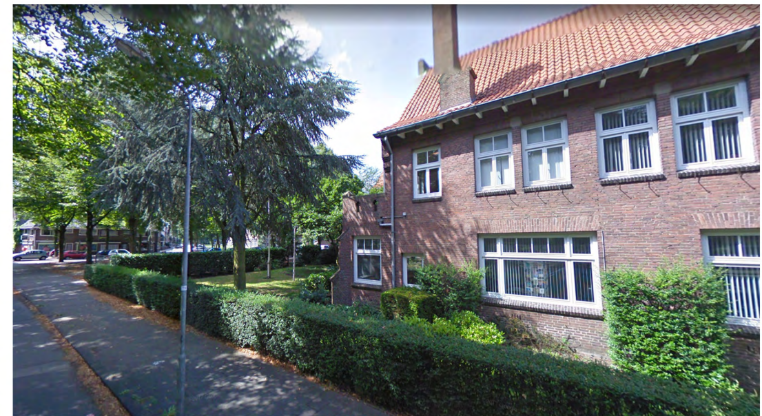
A: erfhaag laag aan Graafseweg, bestaande structuur doorzetten langs voor- en zijgevel nieuwe woningen ( Fagus sylvatica ).