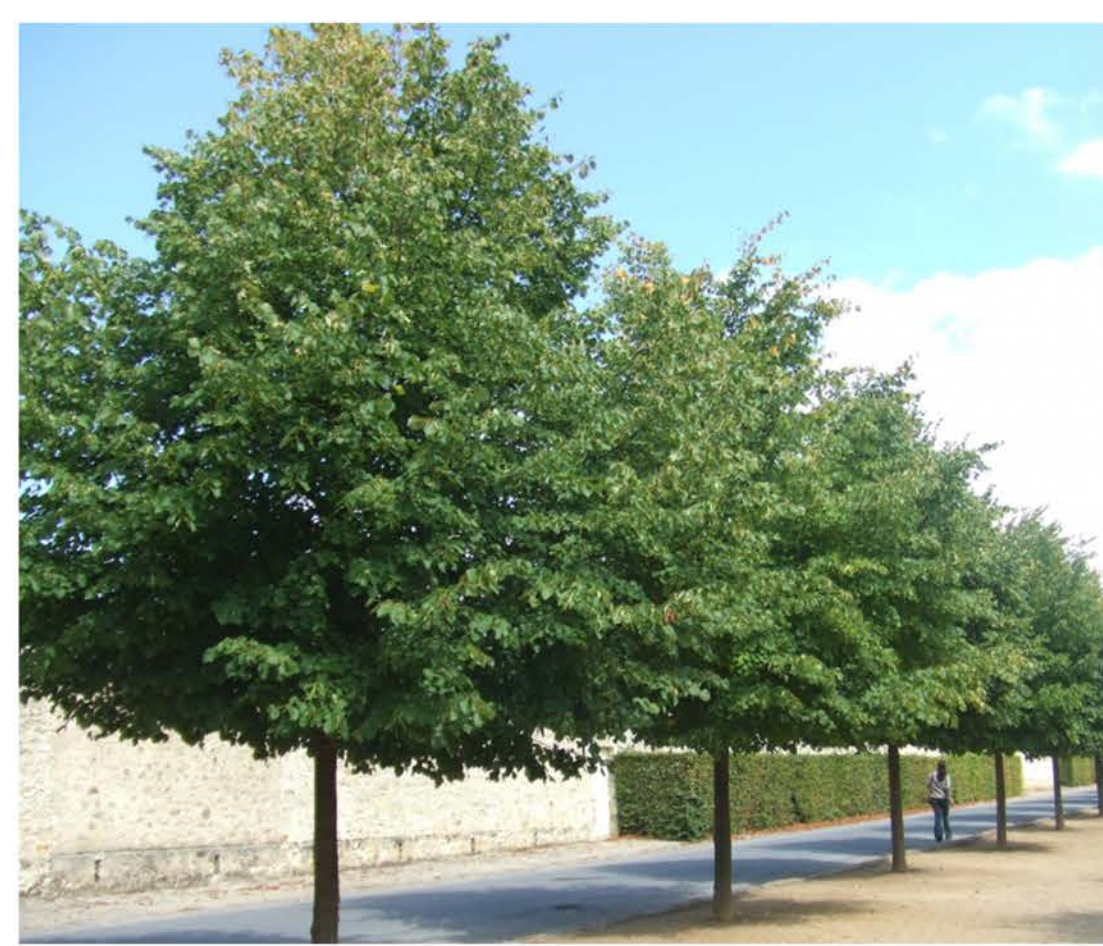
B: Tilia x europaea