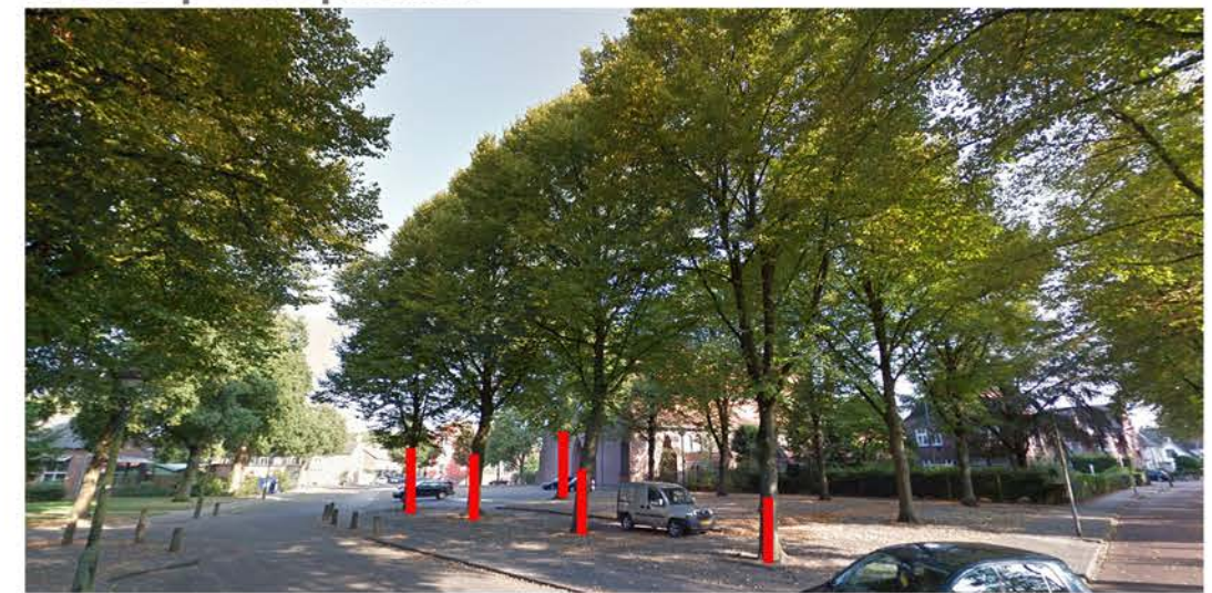
B: Tilia x europaea