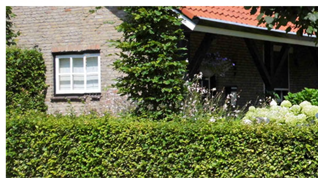
A: nieuwe haag (1.20 m breed, 0.80 m hoog) als omlijsting van de kerktuin, Fagus sylvatica (beuk).