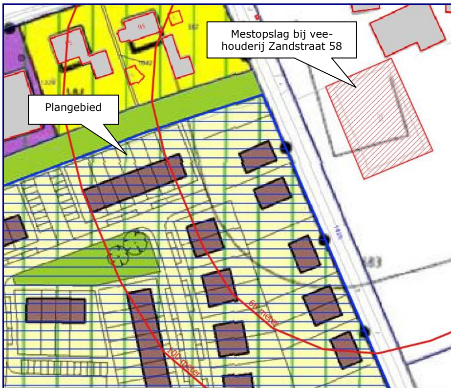
Afbeelding 2. Contour 66 meter rondom mestopslag

De contour van 66 meter ten opzichte van het mestbassin is weergegeven in afbeelding 2.