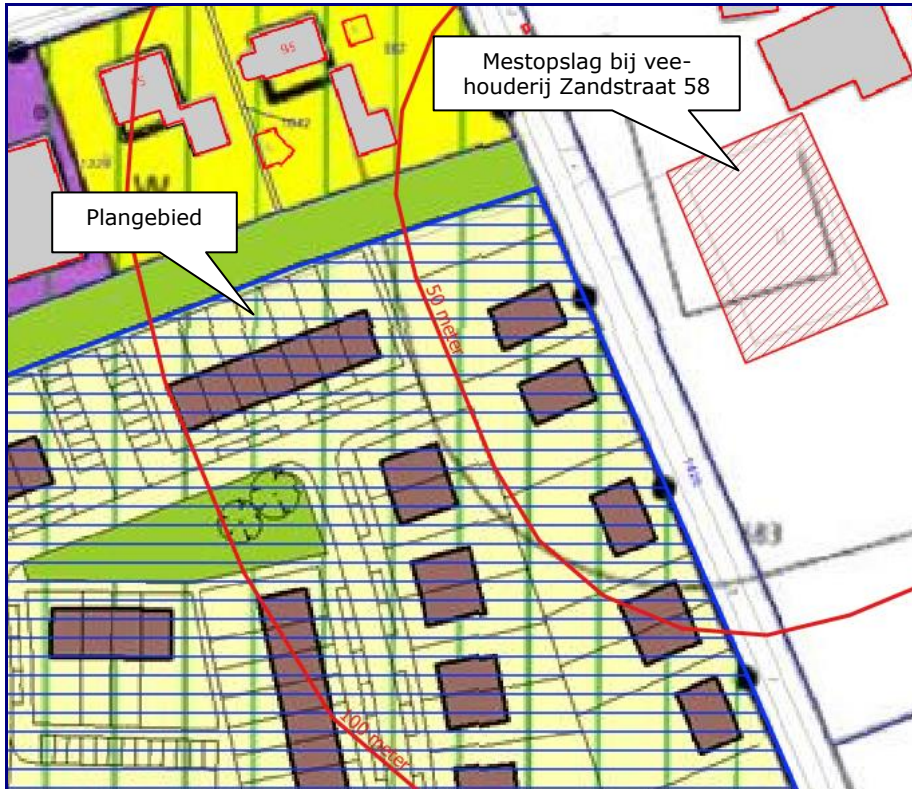
Afbeelding 3. Contour 50 meter rondom mestopslag

De contour van 50 meter ten opzichte van het mestbassin is weergegeven in afbeelding 3.