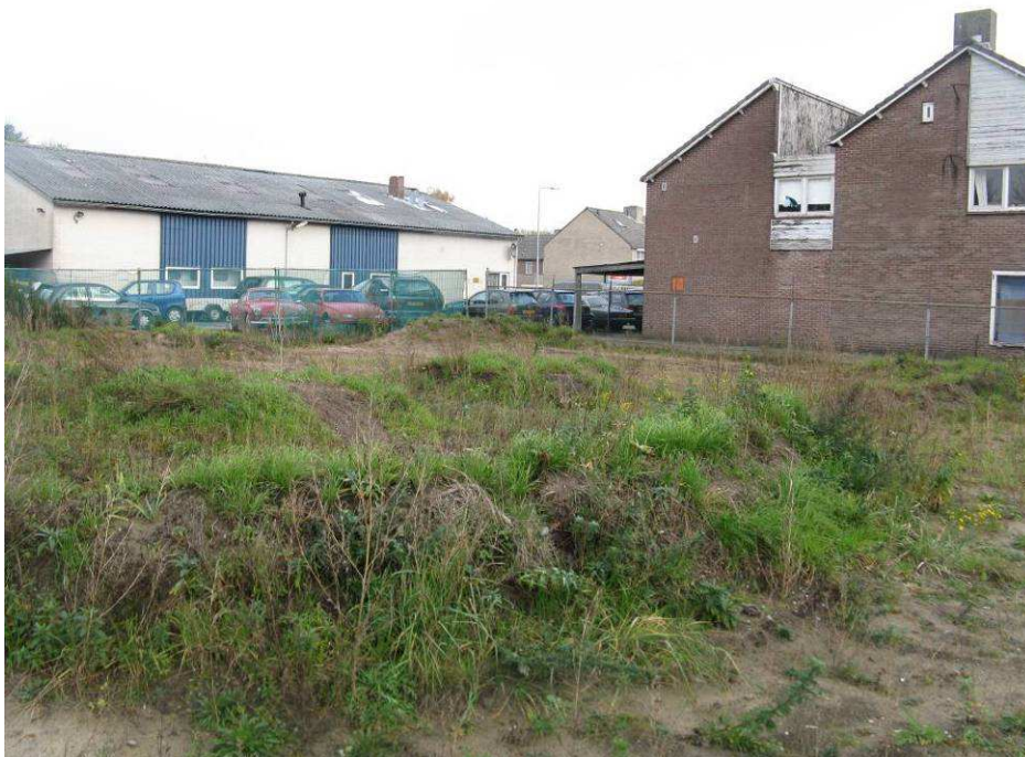
Afbeelding 5.4: Het braakliggend terrein in het zuiden van het plangebied.

Het terrein is in de huidige (verruigde) staat in beperkte mate geschikt voor algemeen voorkomende zoogdieren zoals muizen en spitsmuizen. Ook algemene amfibiesoorten vinden in dit gebied een beperkt geschikt landbiotoop.