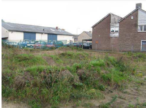
Braakliggend terrein gelegen aan de Oude Baan.