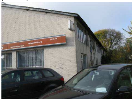
Een te amoveren gebouw in het zuidelijke deel van het plangebied.