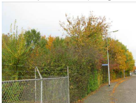
De te verwijderen bosschage in het westelijke deel van het plangebied.