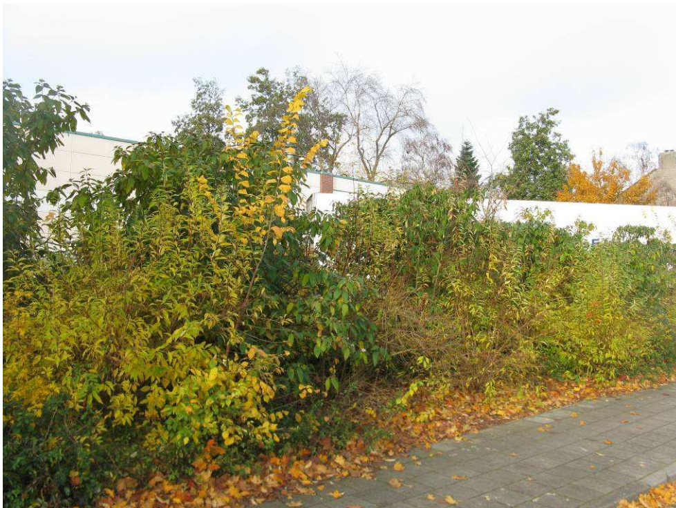
Afbeelding 5.3: De aanwezige tuingroenstrook aan de oostzijde van de Molenhoekpassage.

Ten oosten en zuiden van de Molenhoekpassage bevindt zich respectievelijk een strook (verruigt) tuingroen en een boschage die beide verwijderd zullen worden. Het tuingroen wordt gedomineerd door iep, liguster en forsythia (afbeelding 5.3). De boschage ten zuiden van de passage bestaat grotendeels uit Spaanse aak en veldiep met als ondergroei o.a. sneeuwbes, brandnetel en klimop.