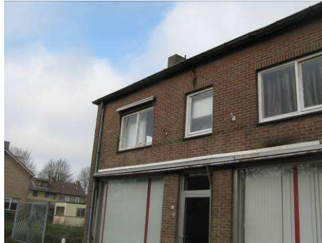
Een leegstaande woning aan de Oude Baan die gesloopt zal worden.