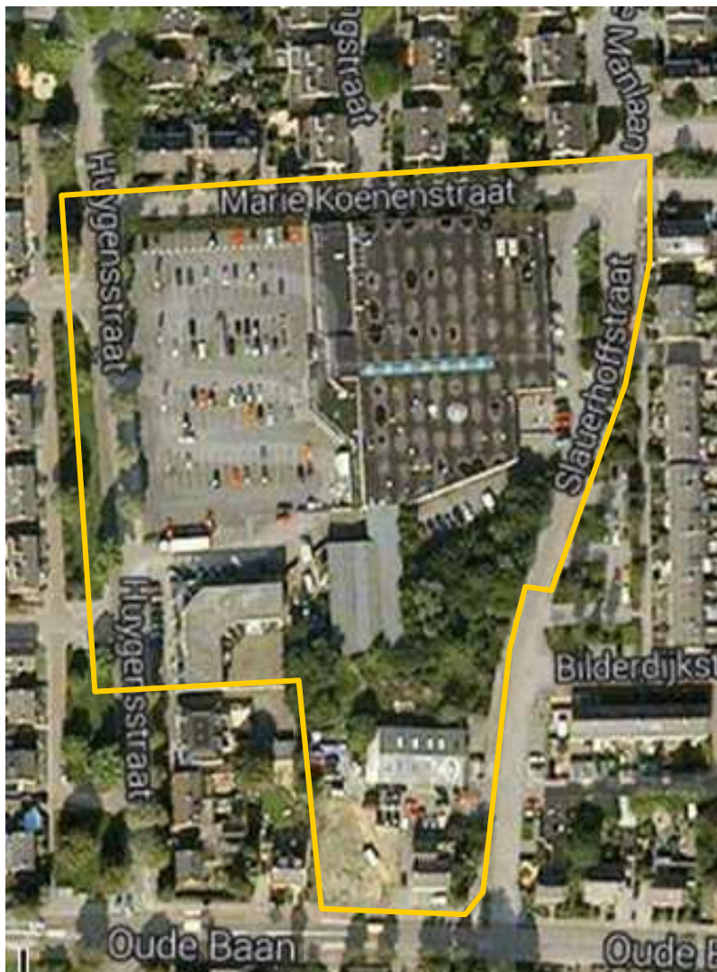
Afbeelding 3.1: Luchtfoto met globale begrenzing plangebied.

Het plangebied ligt in de wijk Molenhoek, in het zuidelijke deel van Rosmalen. Het plangebied wordt ten noorden, oosten en westen begrensd door respectievelijk de Marie Koenenstraat, Slauerhoffstraat en de Huygenstraat. Ten zuiden van het plangebied liggen woningen en de Oude Baan (afbeelding 3.1).