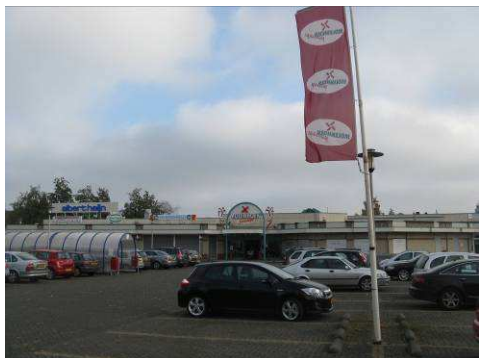
De Molenhoekpassage met bijhorende parkeerplaats.