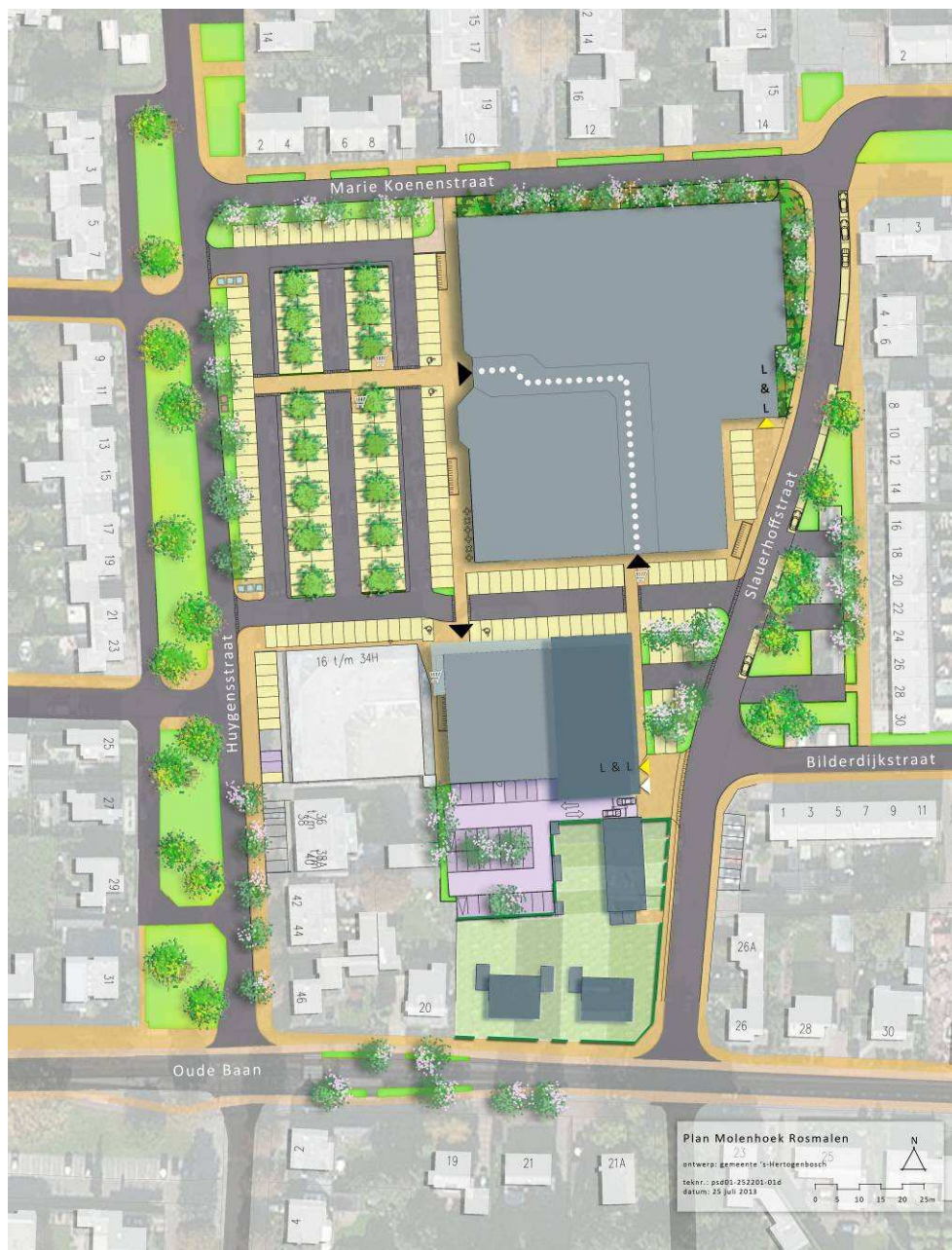
Afbeelding 3.3: Toekomst beeld van de te realiseren woningen en uitbreiding Molenhoekpassage te Rosmalen.