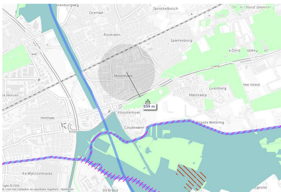
Figuur 5.1: Ligging plangebied t.o.v. EHS gebieden.

Er ligt geen Natura 2000-gebied binnen een afstand van 3 kilometer van het plangebied. Het dichtstbijzijnde Natura 2000-gebied (Vlijmens Ven & Moerputten en Bossche Broek) ligt op circa 5 kilometer afstand.