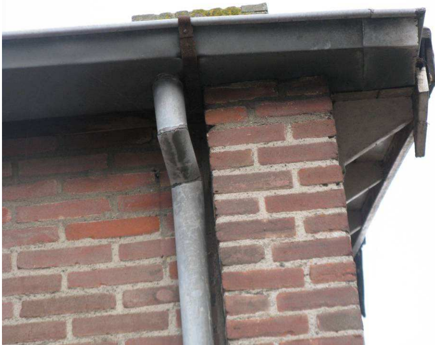
Afbeelding 5.2: Zuidelijke woning met overstek.

Gebouwen zijn in potentie een geschikt leef- en broedgebied voor o.a. vogels en zoogdieren (met name vleermuizen). Tijdens het terreinbezoek zijn geen aanwijzingen aangetroffen die wijzen op broedgeval van vogels. Op basis van de bureaustudie worden de gebouwbewonende soorten gierzwaluw en huismus verwacht. De dakpannen en -platen van de zuidelijk gelegen panden bieden mogelijk geschikte broed-/verblijfplaats voor deze vogelsoorten. De dakpannen bieden toegang tot ondergelegen ruimten en zijn daarmee geschikt als nestlocatie. De soorten zijn daarom niet geheel uit te sluiten van de planlocatie. Met name de huismus kan onder de dakpannen bij de dakgoot van de woning nestgelegenheid vinden. Huismussen zijn in het plangebied waargenomen.