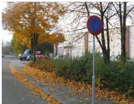
De te verwijderen tuingroenstrook aan de achterzijde Molenhoekpassage.