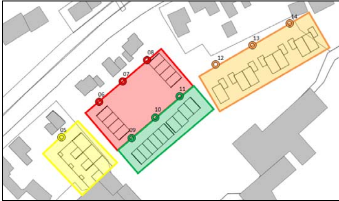
Figuur 3.3 rekenpunten ‘achterliggend gebied’ na realisatie ‘eerstelijnsbebouwing’

Met de uitgangspunten conform rapport 20140788-02 en de in figuur 3.3 weergegeven rekenpunten zijn de geluidbelastingen op 1.5, 4.5 en 7.5 meter berekend. De maatgevende geluidbelastingen per waarneempunt zijn in tabel 3.3 weergegeven. De berekende geluidbelasting per waarneemhoogte is gepresenteerd in bijlage I-3.