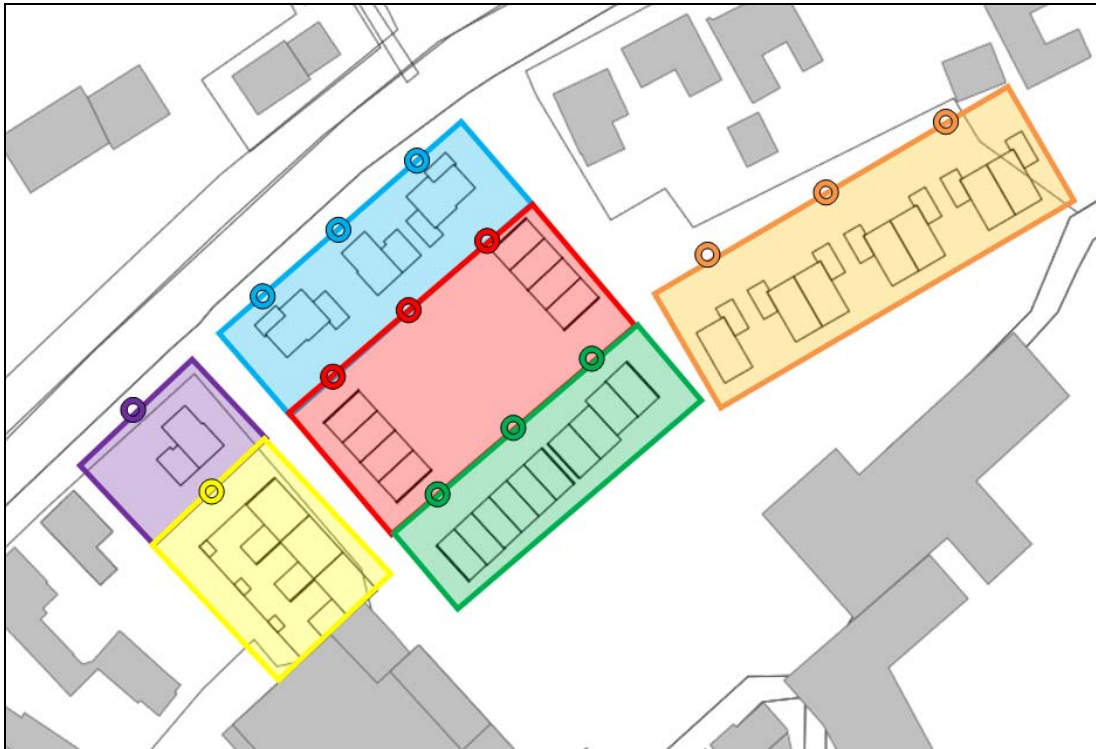
Figuur 2.1 ligging deelgebieden

Het paarse en blauwe deelgebied behoren bij de aanduiding 'eerstelijnsbebouwing'. De overige deelgebieden (geel, rood, groen en oranje) vallen onder de aanduiding 'achterliggend gebied'