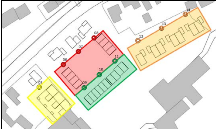
Figuur 3.2 rekenpunten ‘achterliggend gebied’

Met de uitgangspunten conform rapport 20140788-02 en de in figuur 3.2 weergegeven rekenpunten zijn de geluidbelastingen op 1.5, 4.5 en 7.5 meter berekend. De maatgevende geluidbelastingen per waarneempunt zijn in tabel 3.2 weergegeven. De berekende geluidbelasting per waarneemhoogte is gepresenteerd in bijlage I-2.