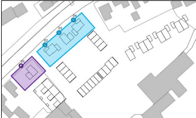
Figuur 3.1 rekenpunten ‘eerstelijnsbebouwing’

Met de uitgangspunten conform rapport 20140788-02 en de in figuur 3.1 weergegeven rekenpunten zijn de geluidbelastingen op 1.5, 4.5 en 7.5 meter berekend. De maatgevende geluidbelastingen per waarneempunt zijn in tabel 3.1 weergegeven. De berekende geluidbelasting per waarneemhoogte is gepresenteerd in bijlage I-1.