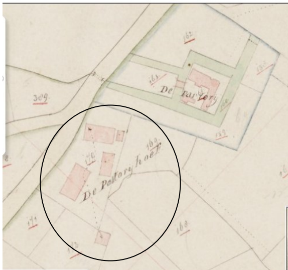
Minuutplan 1832 (watwaswaar.nl)

Het westelijke deel van deelgebied 2 maakt onderdeel uit van de Pastorij Hoef. De verwachting voor de Nieuwe Tijd is daarom hoog. Omdat lagen uit de Nieuwe Tijd in een boorstaat niet te onderscheiden zijn van recente verstoringen is booronderzoek een minder geschikte methode om vindplaatsen uit deze periode op te sporen.