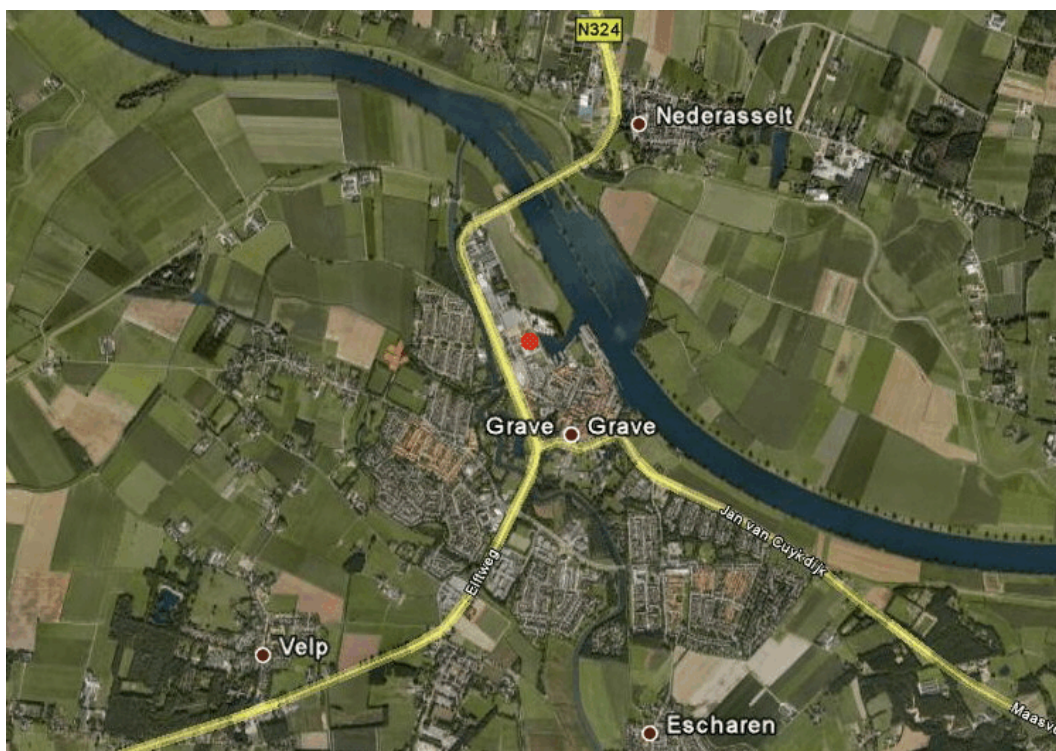
Ligging plangebied