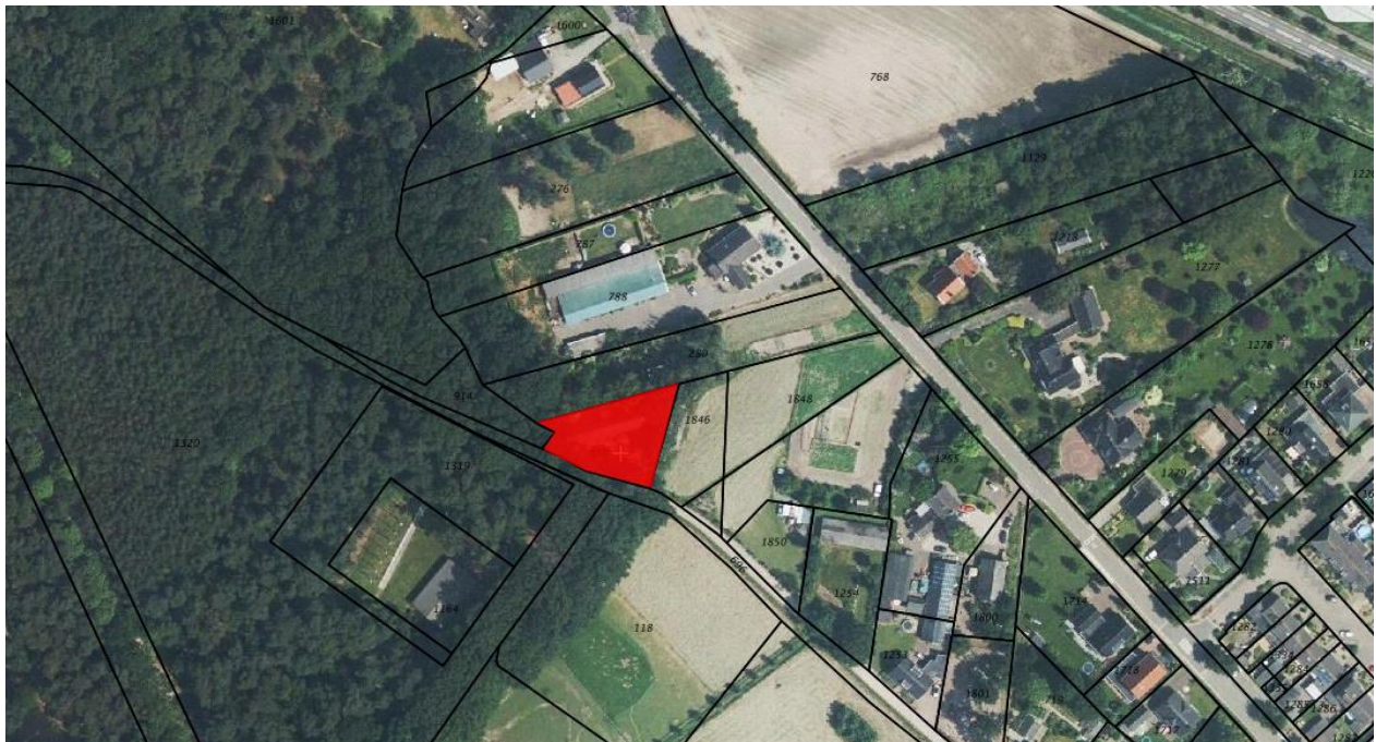
Figuur 1: overzicht erf, huidige situatie

De heer en mevrouw Thoonen hebben een voormalige sloopstimmerwerf aan de Molenakker 10 in Gassel in eigendom, grenzend aan hun huiskavel. In het huidige bestemmingsplan buitengebied Grave is de loods op dit terrein niet voorzien van een bouwvlak. Gemeente Grave wil op basis van het overgangsrecht meewerken om de loods mee te nemen in de herziening van bestemmingsplan Buitengebied Grave. De loods krijgt dan de bestemming 'opslag'. Voor dit proces is een landschappelijke inpassing noodzakelijk.