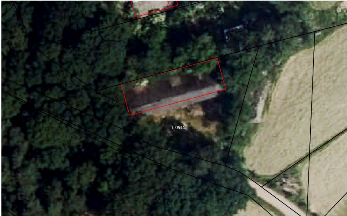
Figuur 3: huidige situatie

Op de locatie Molenakker 10 staat een oude loods op een open plek aan de bosrand. Het terrein is begroeid met grassen, bramen en brandnetels met aan de randen wat opgeschoten vlier en berk. Het geheel maakt een verwaarloosde indruk.