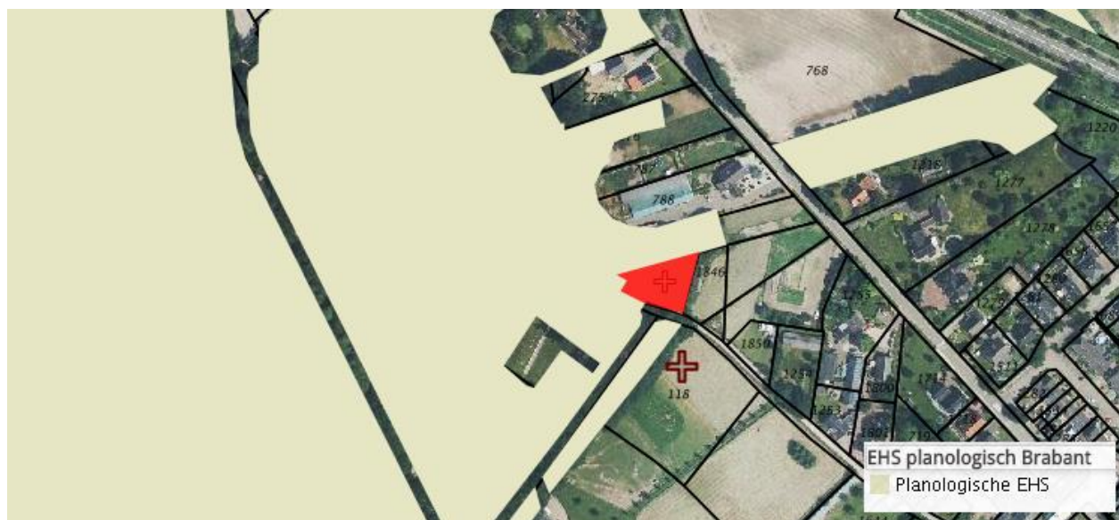
Figuur 6: EHS (NNB genaamd in Noord-Brabant) op de kaart

De locatie Molenakker 10 ligt deels in de provinciale NNB. De locatie niet bij een ecologische verbindingszone (EVZ). Volgens de NNB is het bestaande natuur met het beheertype 'Droog bos met productie'.