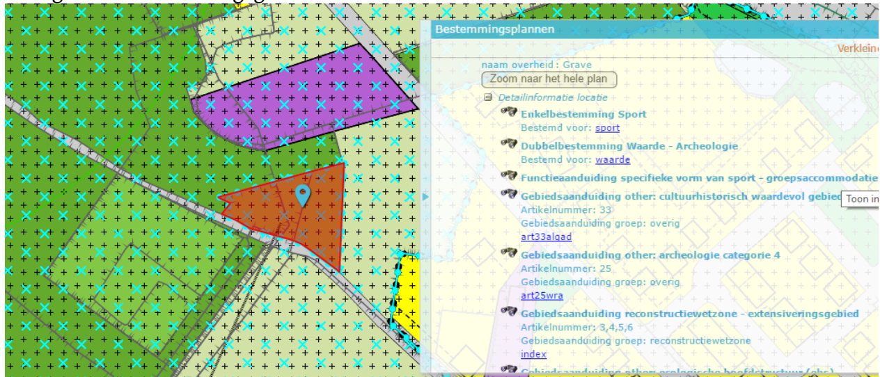
Figuur 7: bestemmingplan Molenakker 10

De inrichting heeft de enkelbestemming 'Sport' in het bestemmingsplan Buitengebied Grave. Er is geen bouwblok aangegeven