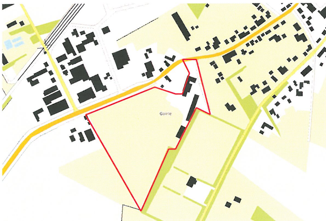
Figuur 1: Plangebied Heisteeg (rood omlijnd)

De Ruimte voor Ruimte-locatie Heisteeg ligt ten zuiden van de kern Riel, in de gemeente Goirle (figuur 1). De locatie wordt aan de noordzijde begrensd door de Alphenseweg. Aan de westzijde wordt de locatie begrensd door de Heisteeg. Ten zuiden/zuidoosten bevinden zich het sportpark van voetbalvereniging Riel en de velden en complexen van een rijnsportvereniging en Scouting. Deze complexen en velden worden gescheiden van het plangebied door een houtsingel met een breedte variërend tussen de 2 en 20 meter. Deze houtwal wordt intensief gebruikt door spelende kinderen afkomstig van het aangrenzende sportpark. De Ruimte voor Ruimte-locatie zelf bestaat voornamelijk uit akkerbouw percelen waarop dit jaar maïs verbouwd wordt. Binnen het plangebied ligt een oude boerderij en schuur. Rondom de bouwwerken aan de oostzijde van de locatie bevindt zich een perceel braakliggend terrein van enkele honderden vierkante meters.