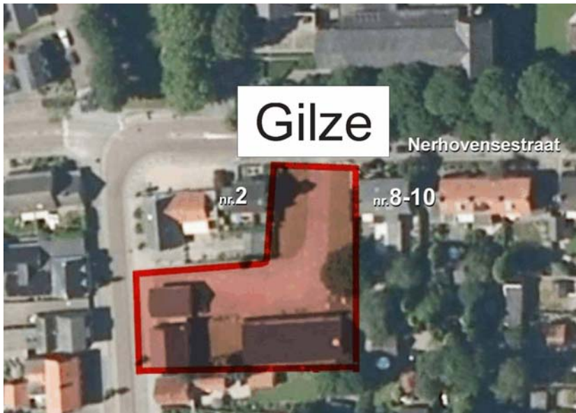
Figuur 3.1. Het plangebied (rood omlijnd).

Het plangebied is weergegeven in figuur 3.1.