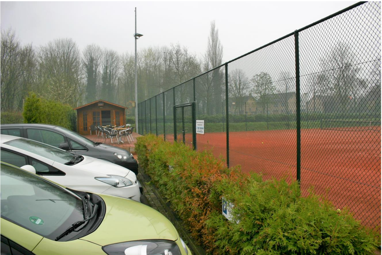
Figuur 4.1.3..Tennisveld en een deel van de parkeerplaats.

Aan de noordzijde van de tennishal is struweel aanwezig (zie kleine foto linksboven op de voorzijde van dit rapport) met zuurbes, ruwe berk, braam, hazelaar, hulst en gewone vlier. Hier groeien ook kruiden als bosaardbei, zuurbes, geel nagelkruid, grote brandnetel en kleine veldkers. Ten noorden van de tennishal is daarnaast een droge greppel met grote lisdodden aanwezig. Op de zuidgrens van het plangebied bevindt zich een haag van Spaanse aak en hazelaar. Op de parkeerplaats in het plangebied bevinden zich een taxushaag en een plantsoentje met mahoniestruik, sneeuwbal, ruwe berk en een rij coniferen. In het westelijk deel van het plangebied bevindt zich een grasveldje dat is omgeven door struweel. Tussen het struweel en de tennishal ligt een slootje.