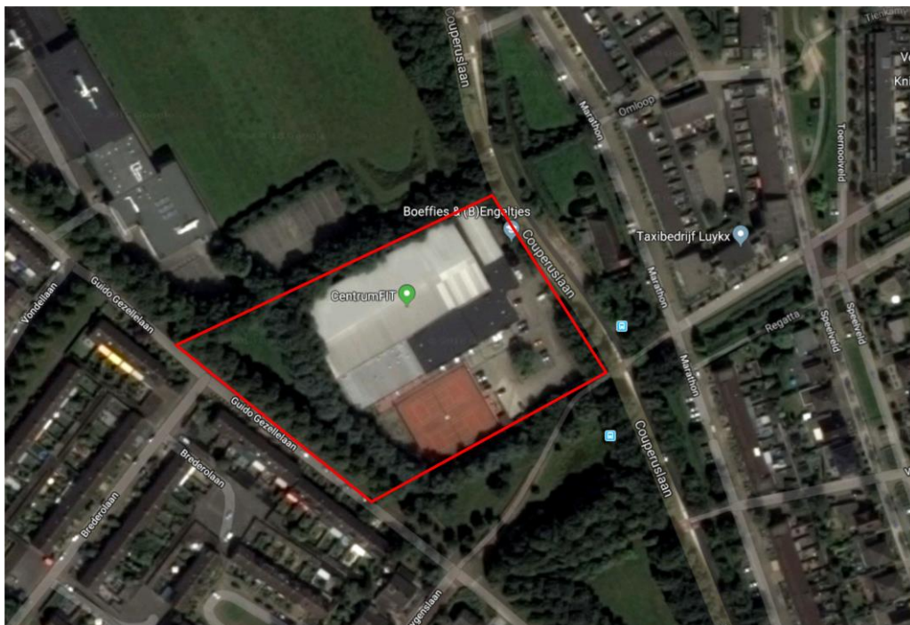
Figuur 4.1.1. Ligging van het plangebied (rood omlijnd).

Het plangebied ligt in het zuidoosten van de bebouwde kom van Etten-Leur en bestaat uit een gebouw met daarin een tennishal en een peuterspeelzaal c.q. kinderopvang (zie figuren 4.1.1 en 4.1.2 en de foto's op de voorzijde van dit rapport). Daarnaast zijn er een parkeerplaats, een tennisveld en een houten tuinhuisje aanwezig (zie figuur 4.1.3).