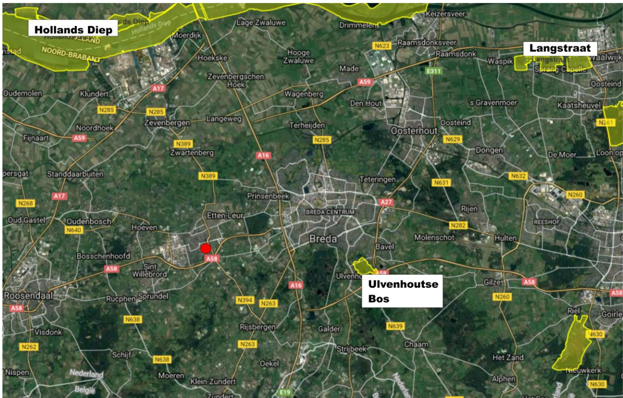
Figuur 4.2. Ligging van het plangebied (rode stip) ten opzichte van Natura 2000-gebieden (geel weergegeven). Bron: www.synbiosys.alterra.nl/natura2000 .