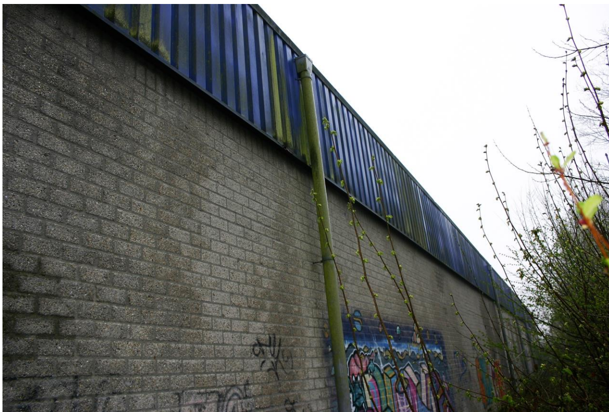
Figuur 4.5.1. De muren van het gebouw zijn deels gemetseld en bestaan deels uit stalen gevelplaten.