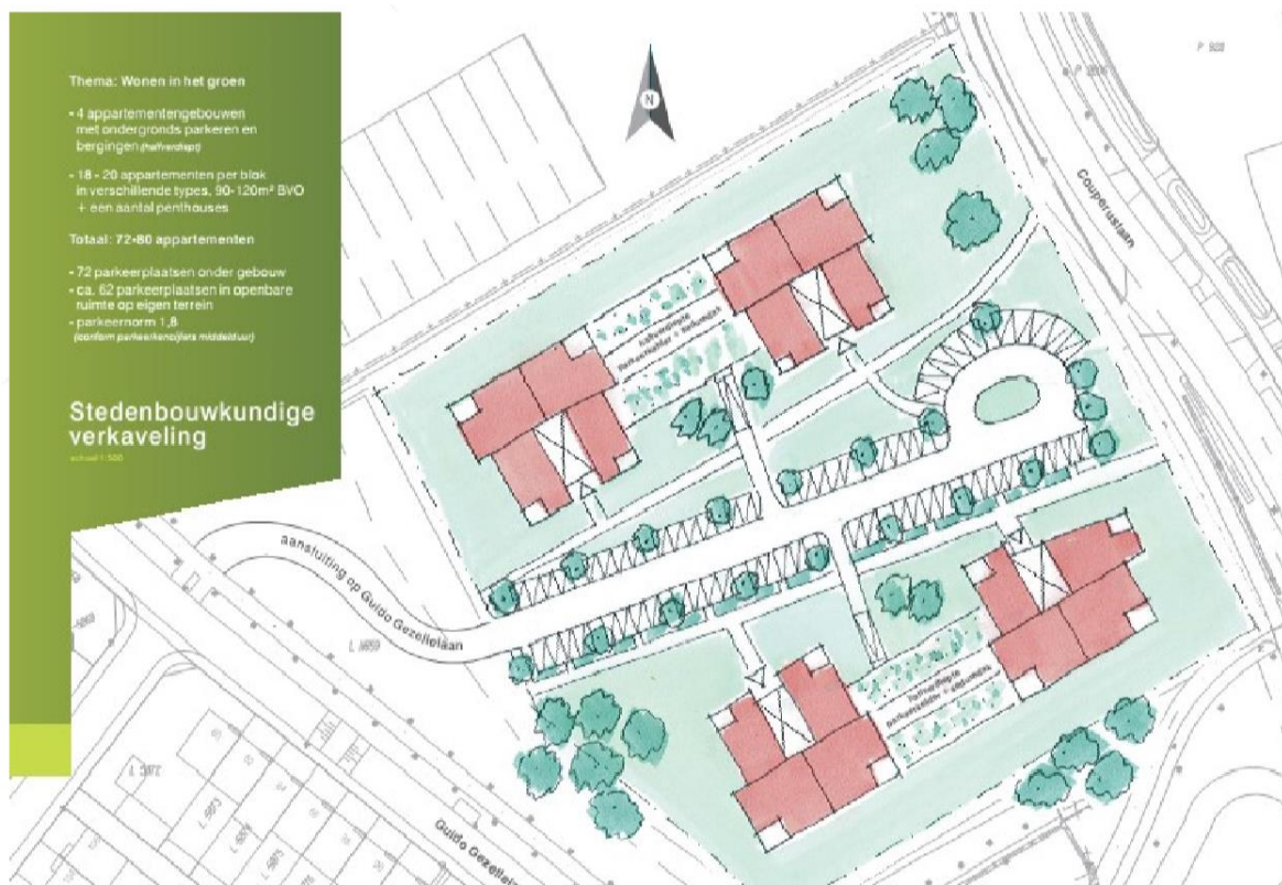
Figuur 3.1. Schets van de voorgestane situatie.

Alle bebouwing wordt gesloopt en een groot deel van de vegetatie wordt verwijderd. Vervolgens worden hier circa 80 appartementen gebouwd met ondergrondse- en bovengrondse parkeerplaatsen (zie figuur 3.1).