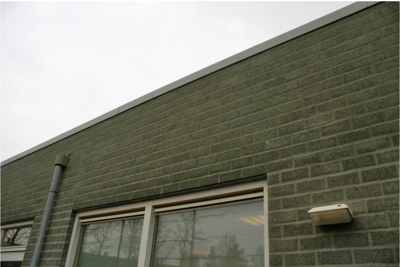
Figuur 4.5.3. De metalen daktrim sluit nauw aan op de gevel.