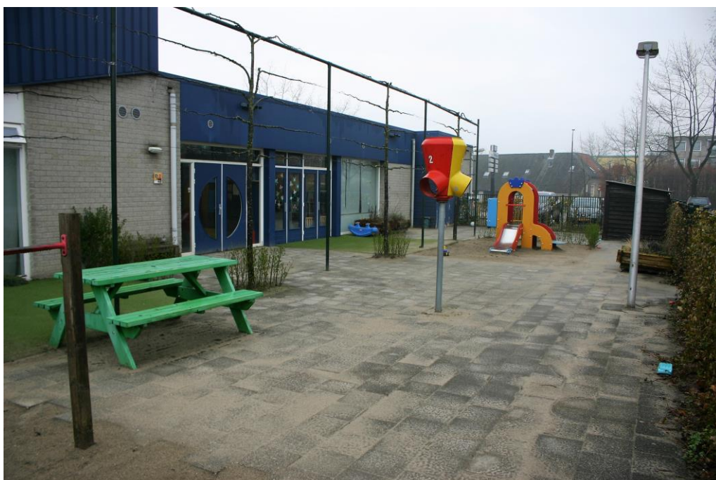
Figuur 4.1.2.. De speelplaats van de peuterspeelzaal/kinderopvang.