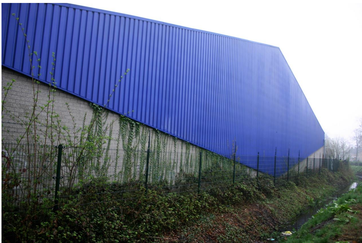
Figuur 4.5.2. De muren van het gebouw zijn deels gemetseld en bestaan deels uit stalen gevelplaten.