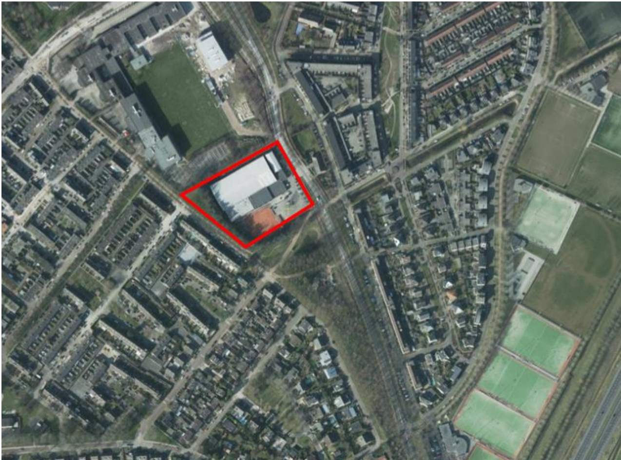
Figuur 1.1. Het plangebied (rood omlijnd).

In opdracht van Accent Adviseurs heeft Aeres Milieu in samenwerking met Faunaconsult een quickscan natuurwetgeving uitgevoerd op een locatie gelegen aan de Couperuslaan/Guido Gezellelaan in Etten-Leur (provincie Noord-Brabant). Zie figuur 1.1. Op deze locatie is nu een tennishal met buitenvelden aanwezig. In het gebouw is ook nog een peuterspeelzaal c.q. kinderopvang aanwezig. Het gebouw wordt gesloopt, waarna er 72 tot 80 appartementen worden gebouwd met zowel ondergrondse parkeerplaatsen (72) als parkeerplaatsen in de openbare ruimte (62).