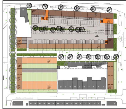
Figuur 2. Toekomstige situatie plangebied.

Er wordt één gebouw gesloopt ten behoeve van de realisatie van het planvoornemen. Dit gebouw is in de zuidwestelijke hoek van het plangebied. Dit gebouw is in een vervallen staat, de ramen zijn dichtgetimmerd er zitten vele gaten in het bouwkundig omhulsel en in het golfplaten dak. De huidige opslagplaats voor bouwwerkzaamheden, de parkeerplaats aan de oostzijde van het plangebied en het aanwezige groen worden verwijderd.