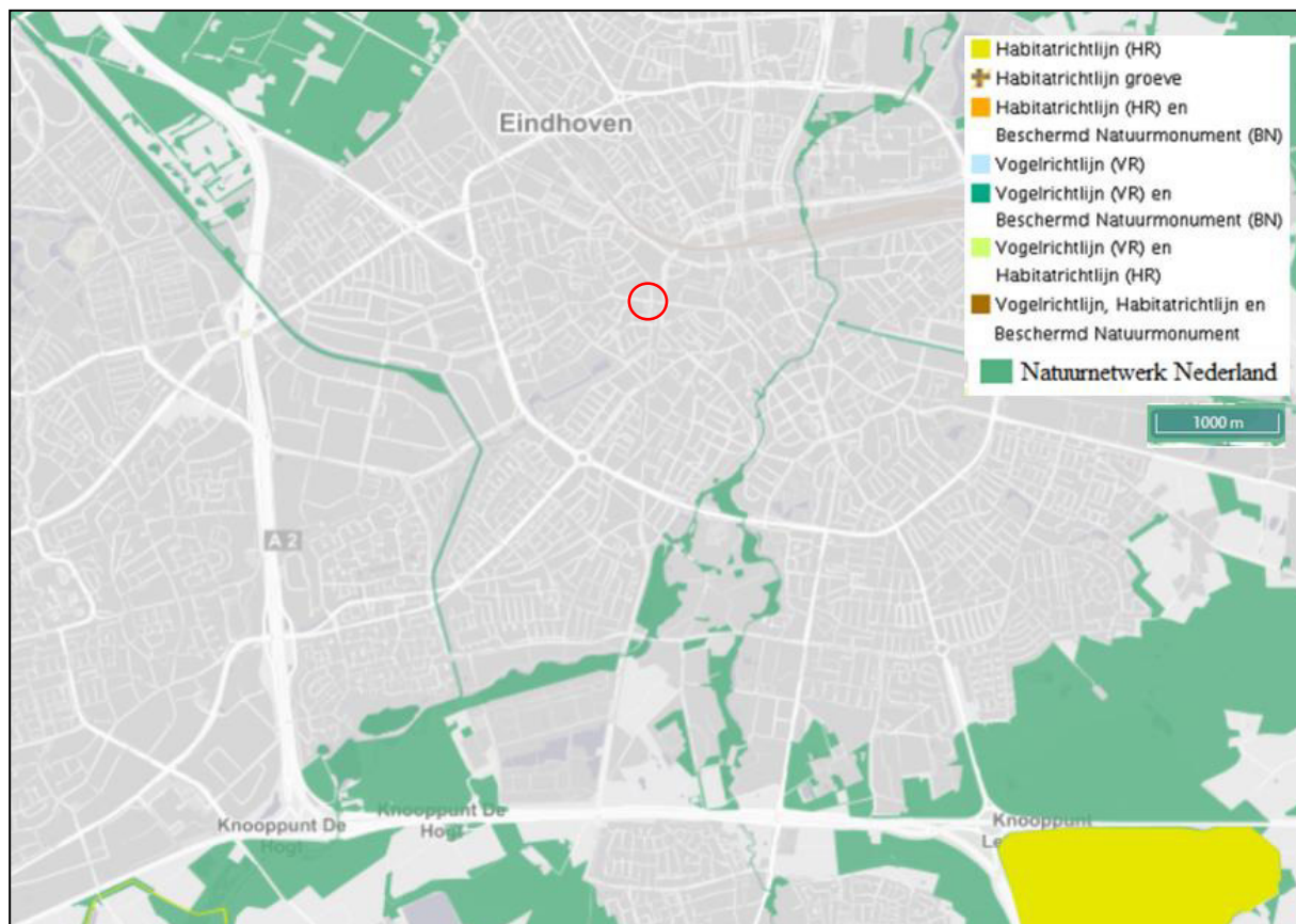
Figuur 4. Plangebied en omgeving met relevante natuurgebieden.

In onderstaande figuur 4 is het plangebied met haar ecologisch waardevolle gebieden in highlights weergegeven. De groene highlights betreffen de Ecologische Hoofdstructuur (EHS), in de provincie Noord-Brabant ook wel Natuurnetwerk Brabant (NNB) genoemd. Het Natura 2000-gebied is met de gele kleur aangeduid.