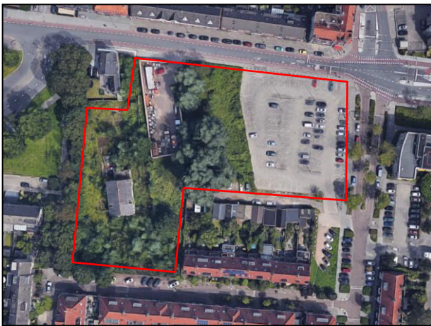
Figuur 1. Huidige situatie plangebied.

In opdracht van Burgland Real Estate B.V. is een quickscan flora en fauna uitgevoerd ten behoeve van de actualisatie van het vigerend bestemmingsplan voor de locatie Vogelzangerterrein te Eindhoven. Het plangebied heeft een oppervlakte van circa 7606 m 2 en bestaat uit perceelnummers 1022, 1443, 1639, 1640, 1771, 1772, 3612, 3613, 3614 en 5263, sectie D, gemeente Eindhoven. De onderzochte percelen bestaan uit bebouwing, bestrating en groen.