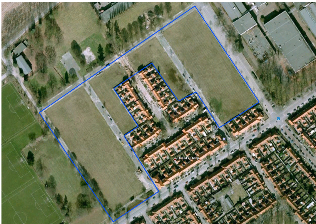
Afbeelding 2: ligging plangebied

Het plangebied is gelegen tussen de Halvemaanstraat, de Apeldoornstraat, de Lochemstraat en de Koenraadlaan te Eindhoven. Het betreft braakliggende gronden rondom Drents Dorp. Oudere bomen, waterstructuren of bebouwing ontbreken op de planlocatie zelf.