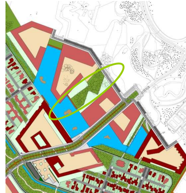
Stedenbouwkundig plan (situatie 2012)

Het kaartje zoals opgenomen in het Beeldkwaliteitsplan was een eerste visie over hoe het gebied er uit zou kunnen komen te zien. Dat er water onder het gebouw zou doorstromen was een idee. Dit is niet expliciet juridisch vastgelegd.. Dit blijkt ook uit verschillende andere tekeningen in het Beeldkwaliteitsplan.