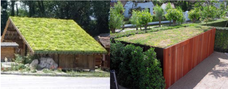
Referentiebeelden toepassingsmogelijkheden groendak op bijgebouwen in alle deelgebieden