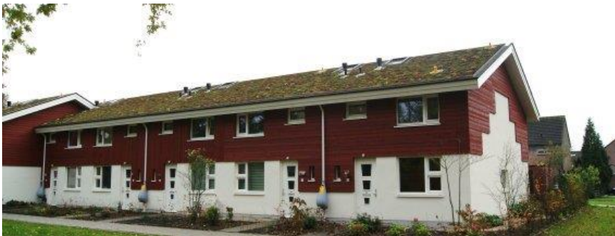
Referentiebeeld gerealiseerde woningen met zadeldak-groendak