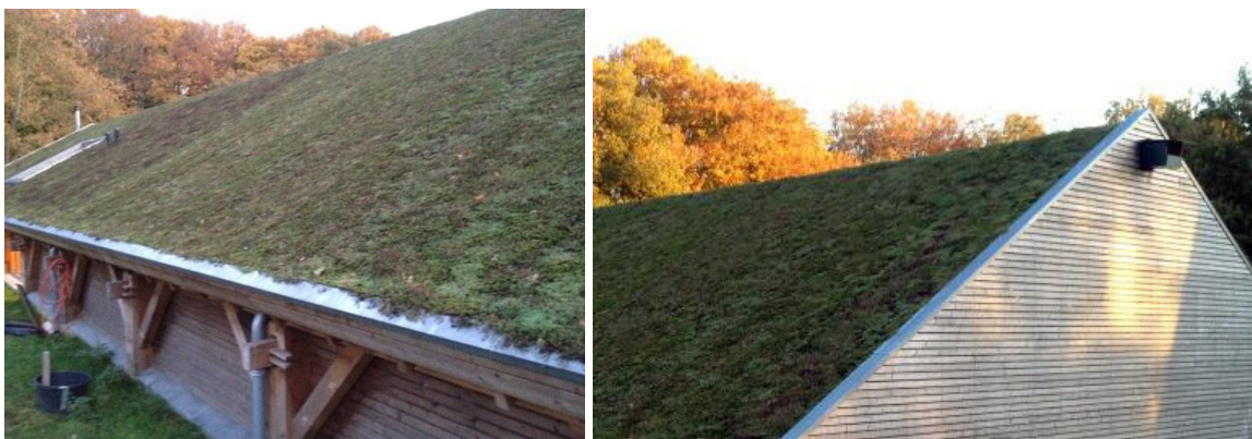
Referentiebeelden gerealiseerde woning met de combinatie schuurtype-groendak