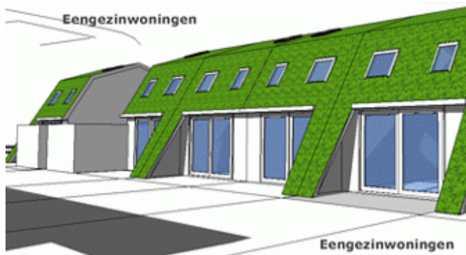
'Artist impressions' woningen met combinatie mansardedak-groendak

Advies: groendaken (gras- en/of vegetatiedaken) in dit subgebied toestaan, mits aan de criteria m.b.t. beeldkwaliteit in dit gebied wordt voldaan.