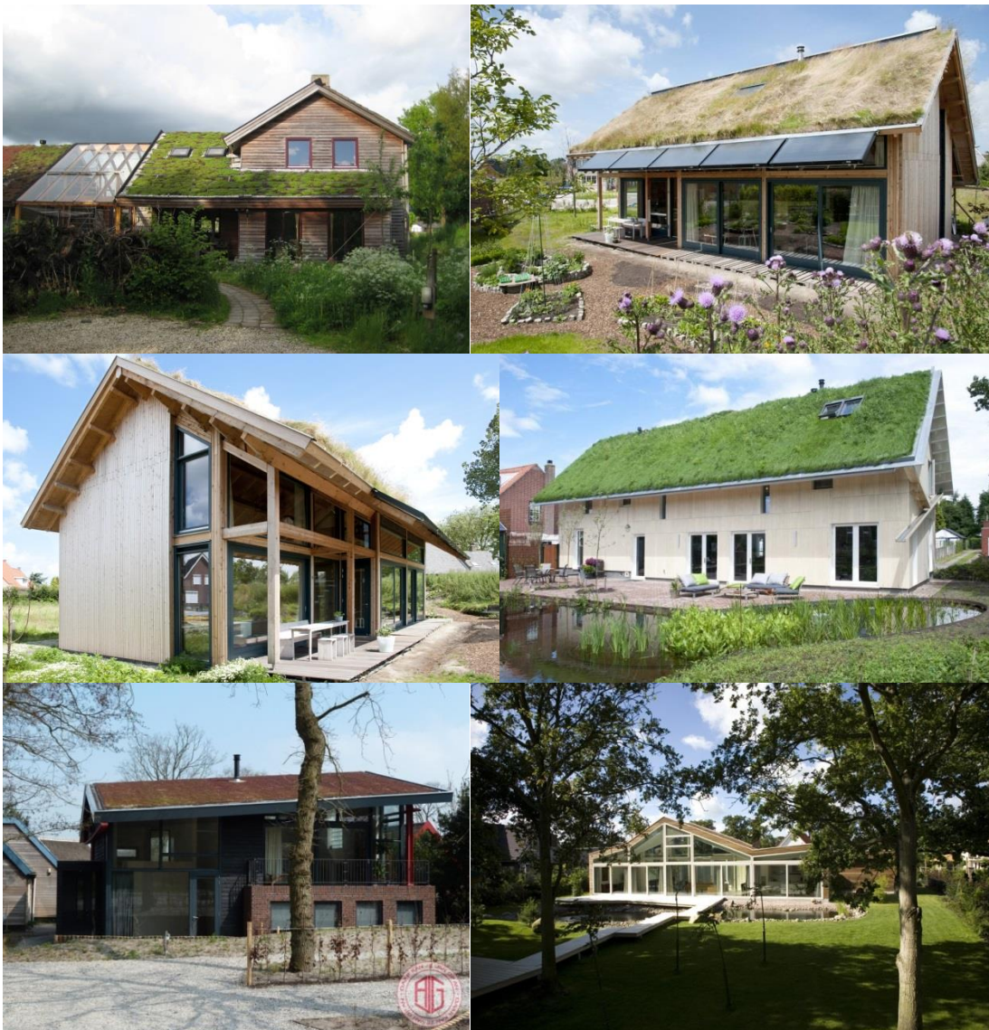
Referentiebeelden mogelijkheden toepassing groendaken in zuidelijk woonveld van deelgebied 'Rondom Hoek'

Advies: groendaken in dit subgebied toestaan, mits wordt voldaan aan de criteria voor beeldkwaliteit met name m.b.t. de vorm en grootte van de kap, zie beschrijving en onderstaande referentiebeelden.