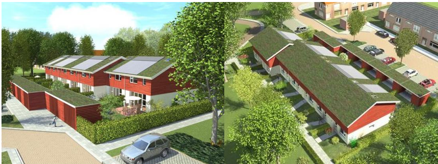
'Artist impressions' van woningen met combinatie zadeldak-groendak