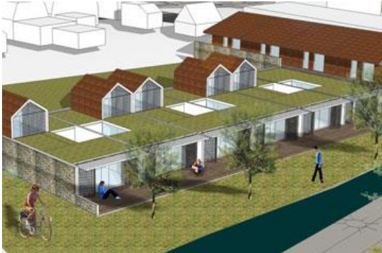
Referentiebeeld mogelijke toepassing groendak op patio woning in deelgebied Dubbellint

In deelgebied De Groene Aders was het gebruik van een kap facultatief. Op de woningen binnen deelgebied "Dubbellint" dient echter verplicht een kap te zitten. Dit mag zowel een zadeldak (let op de richting) als een schilddak zijn. De pannen zijn in harmonie met de gevel en rood of antraciet. De platte gedeelten kunnen ook hier uitstekend worden ingericht als groendaken.