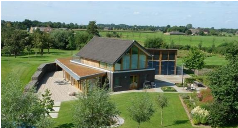
Referentiebeeld toepassingsmogelijkheid groendak op aanbouw in deelgebied 'Rondom Hoek'

Advies: groendaken op bijgebouwen en ondergeschikte volumes (aanbouwen) in alle deelgebieden toestaan mits in overeenstemming met de criteria m.b.t. beeldkwaliteit voor het betreffende deelgebied en niet in strijd met de architectuur van het hoofdvolume.