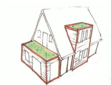
Referentiebeeld toepassing groendak op aanvullende moderne elementen zoals doorgestoken dakkapellen, (verlengde) erkers etc.

Advies: groendaken in dit subgebied toestaan, mits aan de criteria m.b.t. beeldkwaliteit van het gebied wordt voldaan.