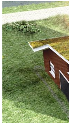
Referentiebeelden mogelijke groendaken in deelgebied 'Dubbellint'