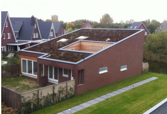
Referentiebeelden groendaken op patiowoningen

Advies: groendaken op deze typen toestaan op het dak van het basisvolume, niet op de opbouwen.