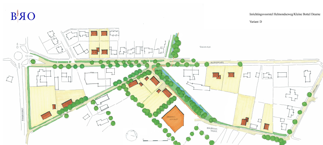
Figuur 2. Inrichtingsvoorstel percelen Kleine Bottel / de Vennen.