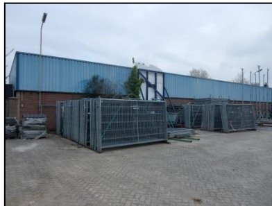
Figuur 7. Achterzijde open loods aan de zuidzijde van het plangebied.