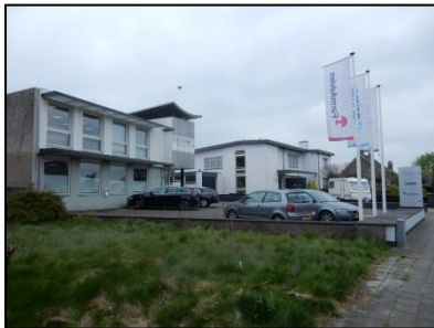
Figuur 6. Kantoorgebouw binnen contouren onderzoekslocatie.