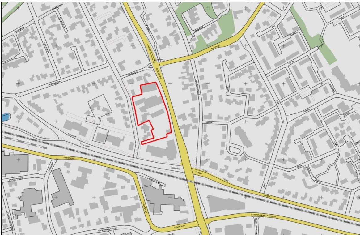
Figuur 1. Topografische ligging van de onderzoekslocatie (rood) omlijnd.

Volgens de topografische kaart van Nederland 1:25.000, zijn de coördinaten van de onderzoekslocatie X = 183.350 , Y = 385.335 .