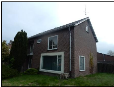
Figuur 3. Woning binnen contouren van de onderzoekslocatie.