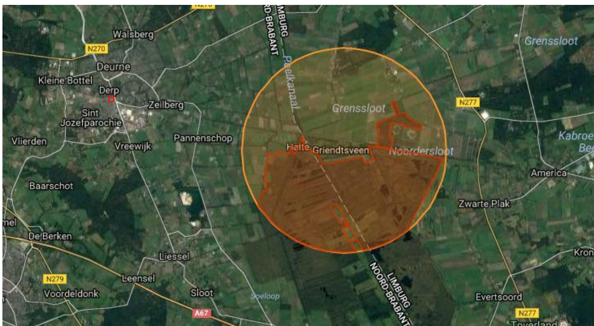
Figuur 9. Ligging onderzoekslocatie (rood) omlijnd ten opzichte van Natura 2000-gebied binnen de oranje cirkel.

De onderzoekslocatie is niet gelegen binnen de grenzen, of in de directe nabijheid van een gebied dat aangewezen is als Natura 2000-gebied. Het meest nabijgelegen Natura 2000-gebied, Deurnsche Peel & Mariapeel, bevindt zich op circa 5,7 kilometer afstand ten oosten van de onderzoekslocatie. In onderstaande figuur 9, is de ligging van de onderzoekslocatie ten opzichte van het dichtstbijzijnde Natura 2000-gebied weergegeven.