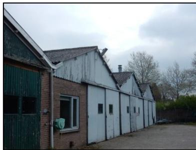
Figuur 4. Gesloten loods aan de noordzijde van de onderzoekslocatie.