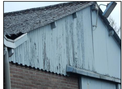
Figuur 8. Dakconstructie loods bestaat uit aaneengesloten dakpanelen.