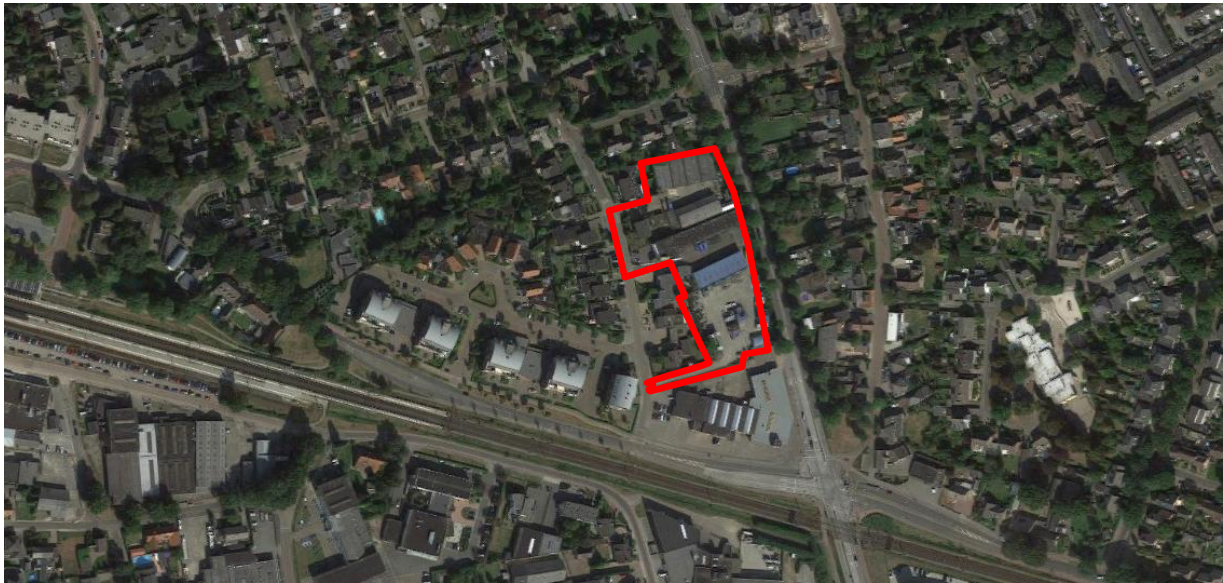
Figuur 2. Luchtfoto onderzoekslocatie en directe omgeving.