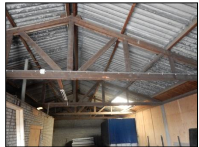
Figuur 5. Binnenzijde gesloten loods.