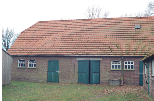
Bedrijfsgedeelte aan de achterzijde

Het bedrijfsgedeelte van de boerderij bevat van links naar rechts onder strekken twee getoogde zesruits betonnen stalvensters met kleppende bovenlichten, een getoogde houten loopdeur, een dubbele staldeur onder een betonnen latei, twee getoogde zesruits stalvensters en nog een getoogde houten loopdeur.