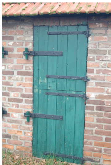
Andere gevel schuur