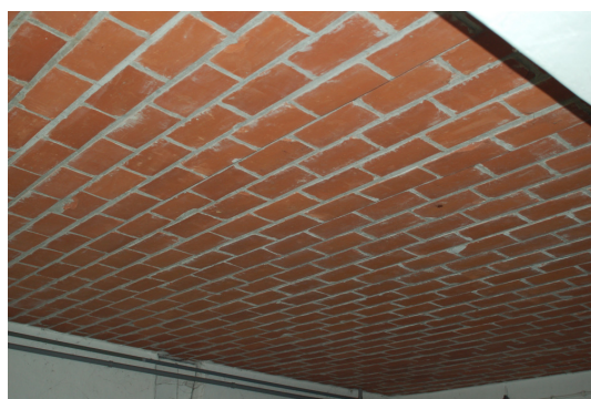
Gemetseld plafond in het stalgedeelte