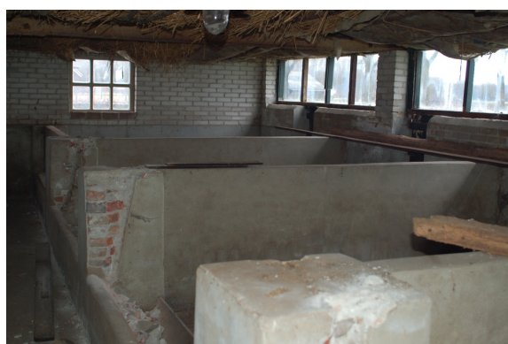
Interieur van de vrijstaande varkensstal