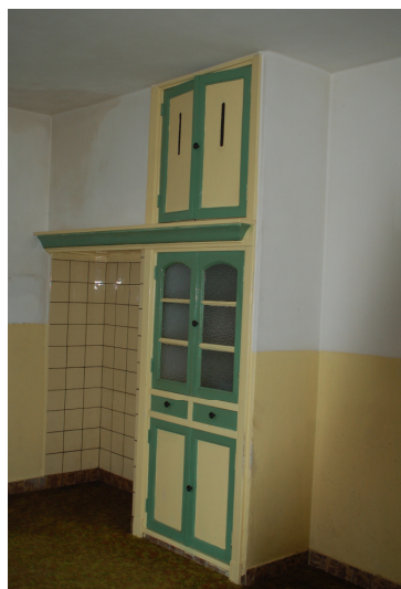
Schouw in de keuken