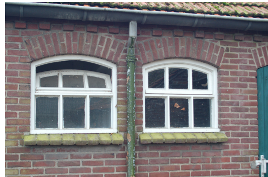
Stalvensters in de achtergevel