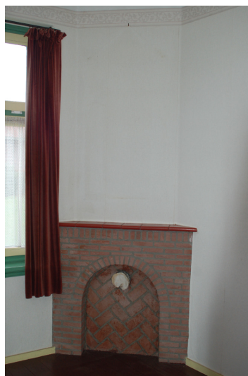
Schouw in de goeikamer