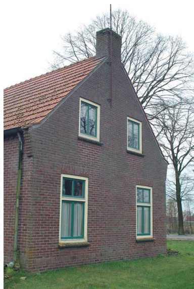
De kopgevel van het woongedeelte Venster

Het betreft de kopgevel van het woongedeelte. De gevel bevat op de benedenverdieping onder een strek twee T-vensters met tweeruits bovenlicht. De vensters zijn voorzien van bakstenen lekdorpels. De bovenverdieping bevat twee vierkante tweeruits vensters met bakstenen lekdorpel. Bij de aanzet van het dak zijn smalle schouders gemetseld. De gevel eindigt in een doorgetrokken gemetselde schoorsteen.