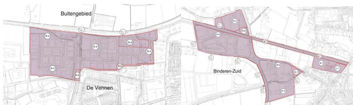
Overzicht bestaande regelingen Bedrijventerreinen West