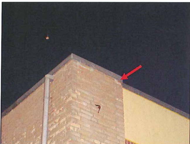
Foto1: rode pijl geeft invlieg gat aan.