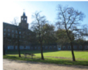
3. het ensemble