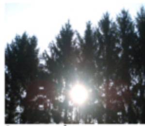
1. groene kamers