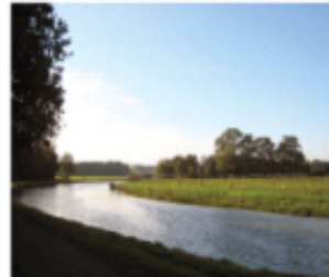
2. het Markdal