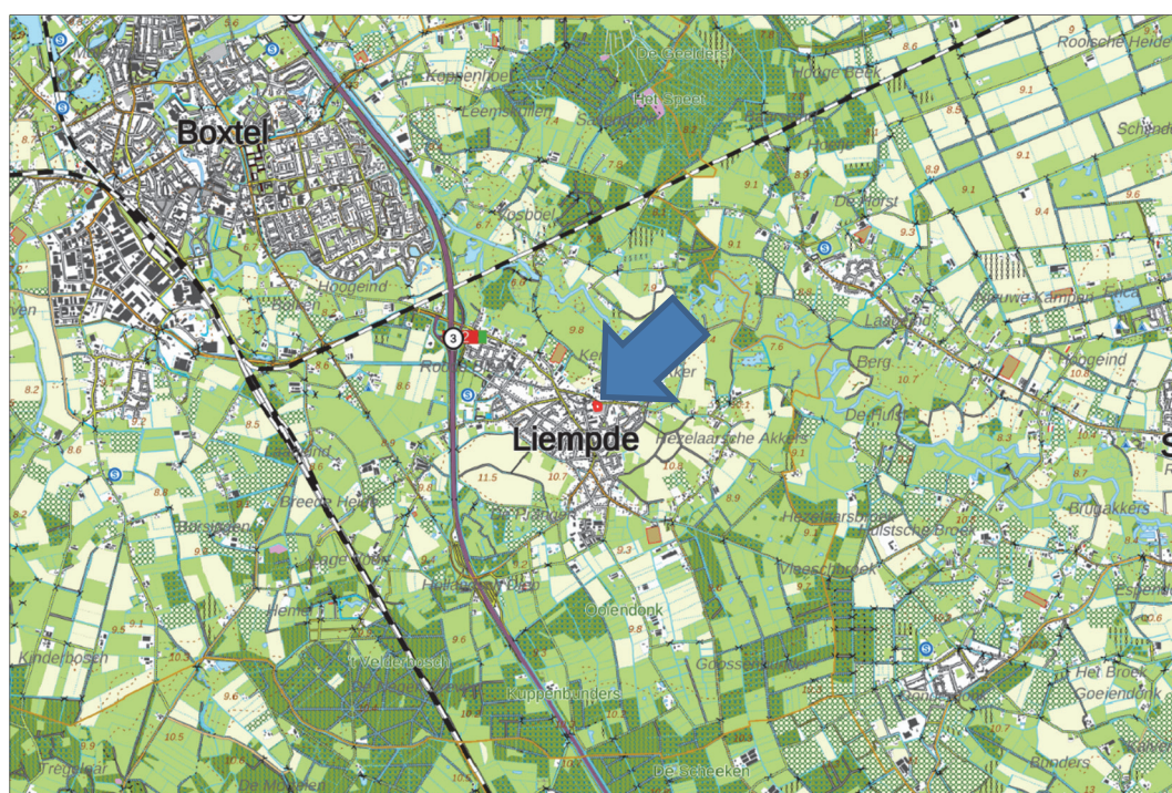
Figuur 1. Topografische kaart ligging van het plangebied (1:25.000)

Het plangebied is gelegen in het centrum van Liempde, direct ten noorden van de begraafplaats achter de Sint-Jans Onthoofdingkerk, direct ten oosten van de pastorie. In figuur 1 is de topografische ligging van het plangebied weergegeven.