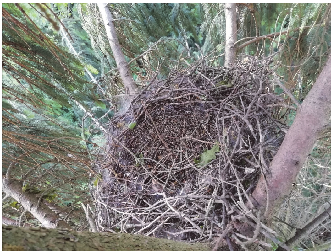
Figuur 11. Lege nestlocatie binnen plangebied

het nest dit broedseizoen in gebruik is of is geweest. Er zijn bijvoorbeeld geen prooiresten, eierschalen of krijstrepen aangetroffen (figuur 11). Het nest is daarmee niet in gebruik door een soort met jaarrond beschermd nest. Daarnaast broedt een paar slechtvalk op de kerktoren direct ten noorden van het plangebied, deze blijft behouden en wordt redelijkerwijs niet verstoord. Ook kunnen in het plangebied mogelijk "algemene" soorten als merel, roodborst, heggenmus, zwartkop, winterkoning en houtduif tot broeden komen. Daarnaast kan het plangebied dienstdoen als leefgebied voor enkele soorten met jaarrond beschermd nest. Huismus kan broeden aan de overzijde van de weg en kan in dat geval gebruik maken van de haag langs de Vendelstraat en mogelijk enkele van de struiken in de pastorie-tuin. Van de haag wordt maar een deel gesloopt. Het grootste deel blijft aanwezig waardoor er voldoende schuilmogelijkheid voor deze soort overblijft. De sperwer heeft naast een nestlocatie ook geschikt foerageergebied binnen het plangebied. Voor de slechtvalken biedt het plangebied geen geschikt leefgebied. Deze soort rust op de kerk en het nest, en foerageert in een zeer ruime omgeving van het nest, waarbij het plangebied zelf een verwaarloosbare rol speelt.