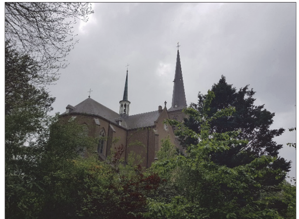
Figuur 9. Zicht op kerk met nest slechtvalk vanaf pastorietuin