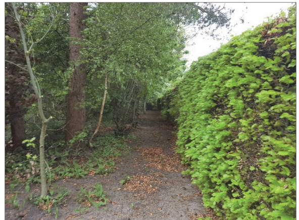
Figuur 7. Achterzijde pastorietuin, langs rand met begraafplaats