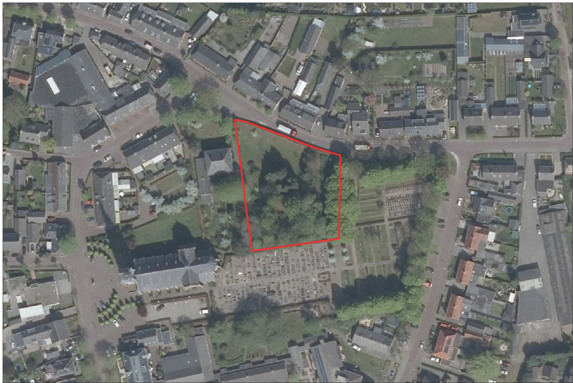
Figuur 2. Luchtfoto van het plangebied en de directe omgeving