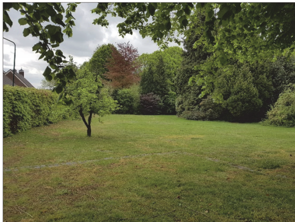
Figuur 6. Pastorietuin gezien vanaf oprit pastorie