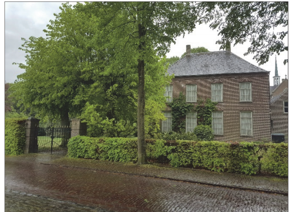
Figuur 5. Pastorie vanaf de Vendelstraat met er voor de bijzondere lindebomen