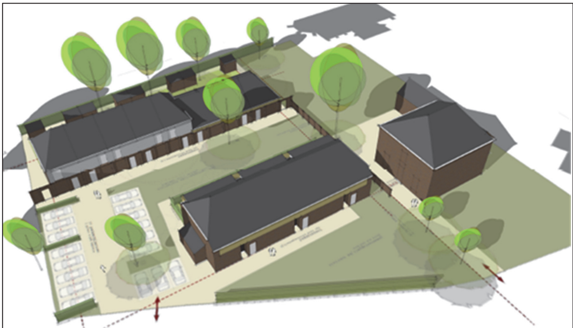
Figuur 3. Schetsontwerp / stedenbouwkundige opzet