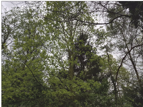
Figuur 8. Bomen binnen pastorietuin, in de naaldboom is het lege nest aanwezig