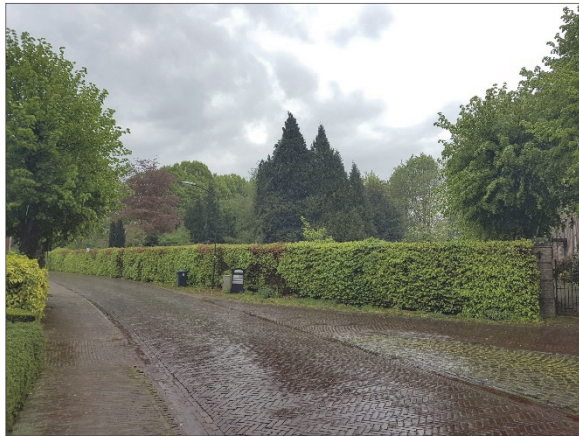
Figuur 4. Plangebied vanaf de Vendelstraat