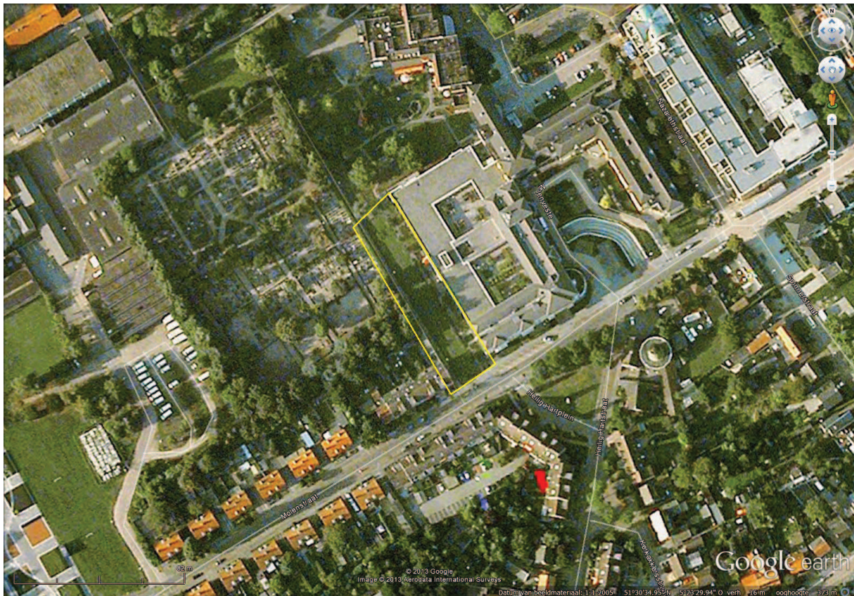
Figuur 1: Locatie van de planlocatie (geel omlijnd) ten oosten van de begraafplaats.