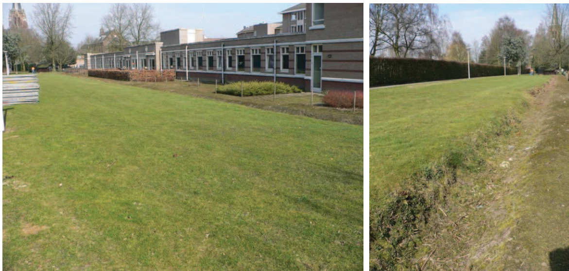
Figuur 2: Overzicht van het terrein.