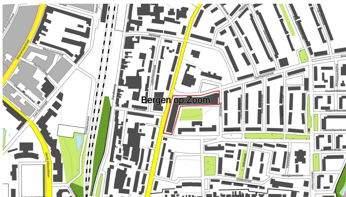
Figuur 1 Ligging van het plangebied, met de begrenzing in rood aangegeven.

De noordelijke vleugel van het complex ligt ingeklemd tussen het Piusplein en het Berkenpad en de westelijke vleugel tussen de Kastanjelaan en het Berkenpad in Bergen op Zoom (provincie Noord-Brabant).