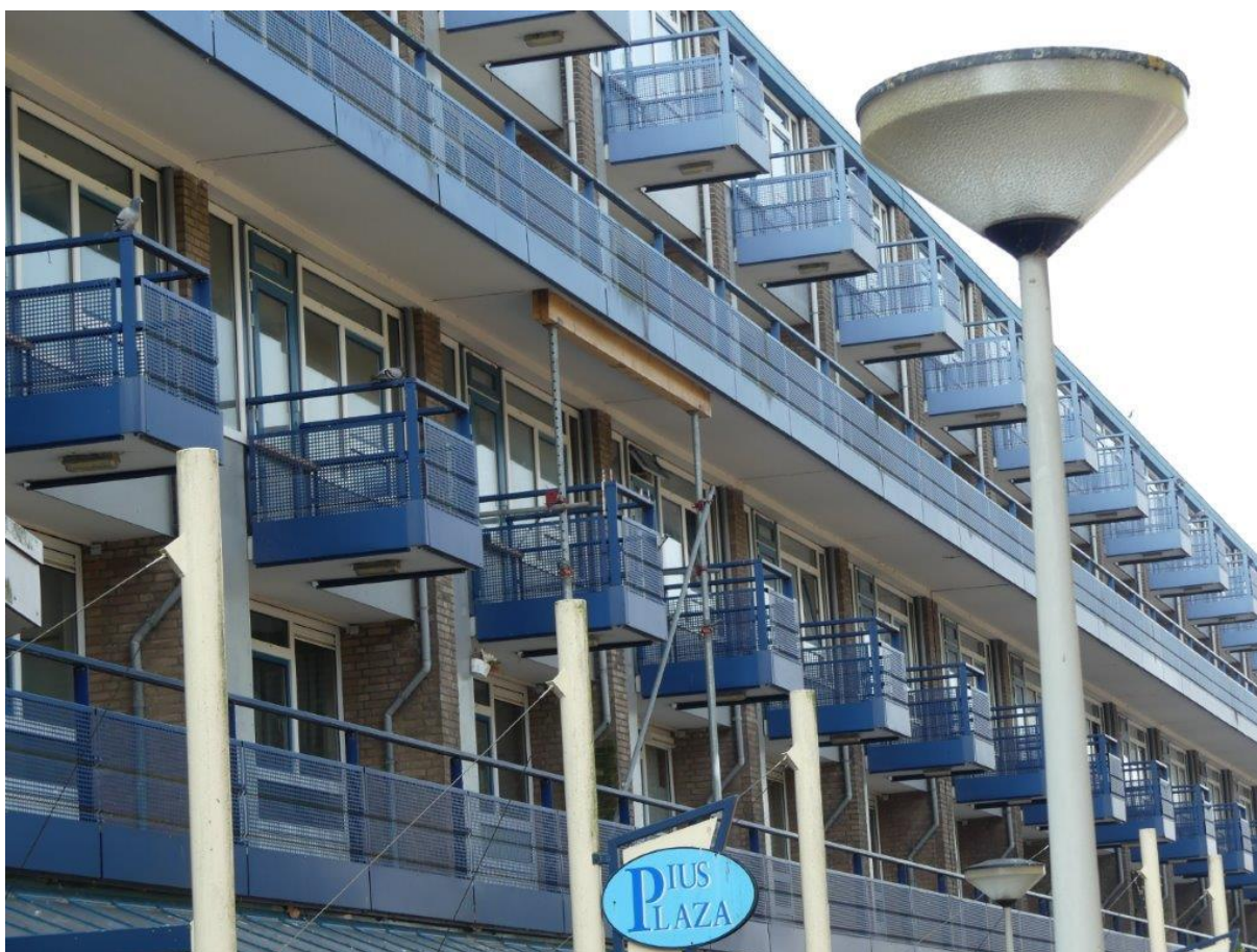
Foto 1 Het plangebied bestaat uit een galerijflat. De staat van onderhoud is niet optimaal.