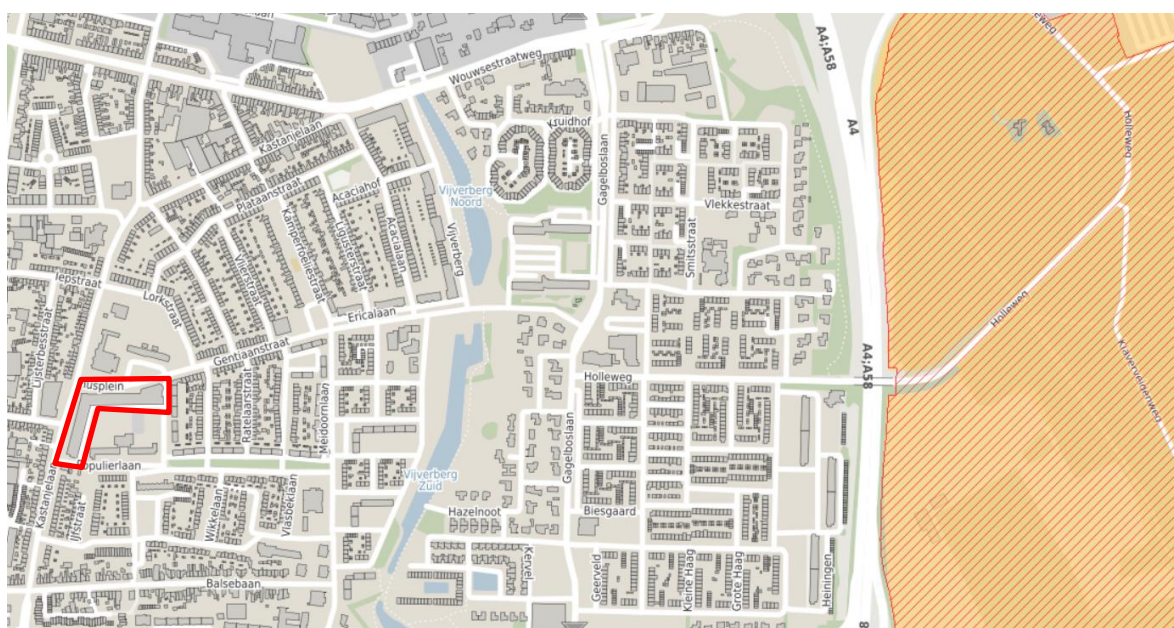
Figuur 2 Ligging van het plangebied (begrenzing in rood aangegeven). De ligging van het NNN is in oranje aangegeven. De ligging van Natura 2000-gebieden is met rode arcering aangegeven.

Het plangebied ligt op 1,1 kilometer afstand van het NNN.