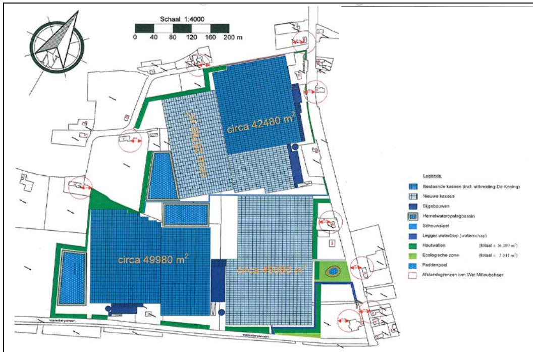
Afb. 3: Voorbeeld clustering landschappelijke inpassing in Glastuinbouw vestigingsgebied Etten-Leur

Indien één of meerdere bedrijven die de landschappelijke inpassing clusteren een ontwikkeling hebben die behoort tot categorie 3 van deze notitie, dan kan het zo zijn dat aanvullend individuele afspraken worden gemaakt met deze ondernemers over extra kwaliteitsverbetering bovenop de landschappelijke inpassing.