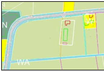
Afb. 1: Bestaande situatie