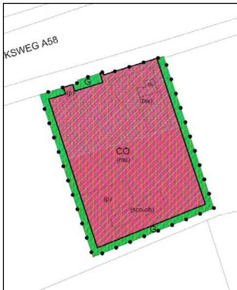
Afb. 4: Traditionele landschappelijke inpassing