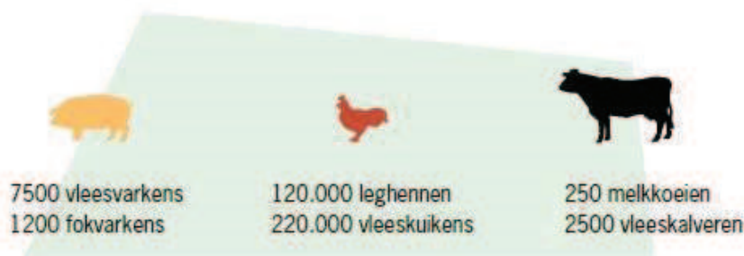
Figuur 3.2 Maximale dierenaantallen bouwvlak 1 tot 1,5 ha (bron: Alterra, rapport 1581)