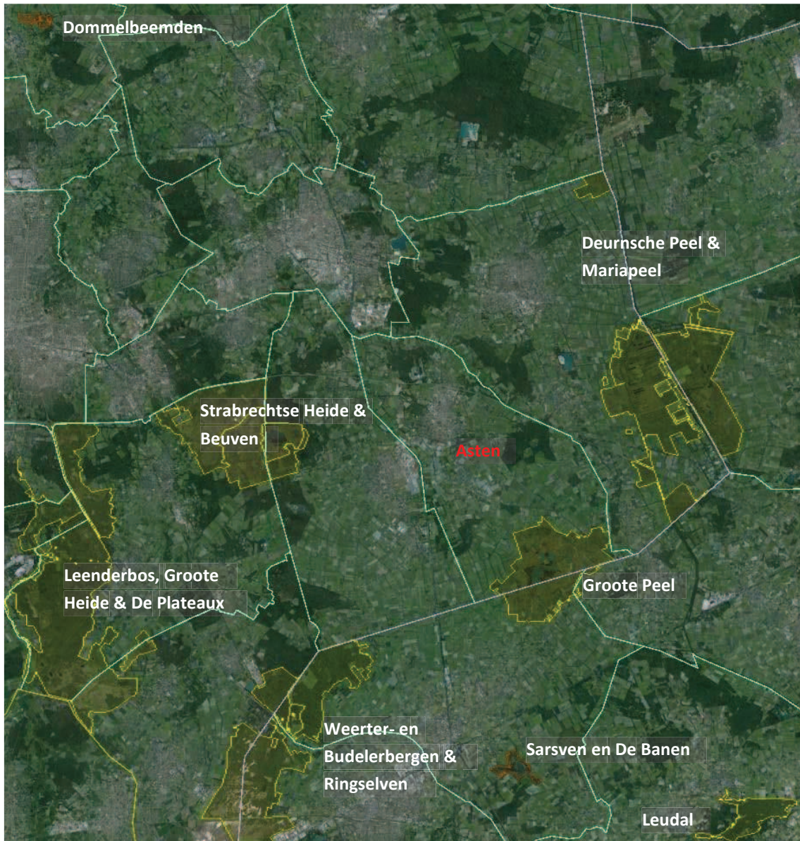
Figuur 1 Ligging Natura 2000-gebieden (geel) en beschermde natuurmonumenten (oranje) t.o.v. gemeente Asten