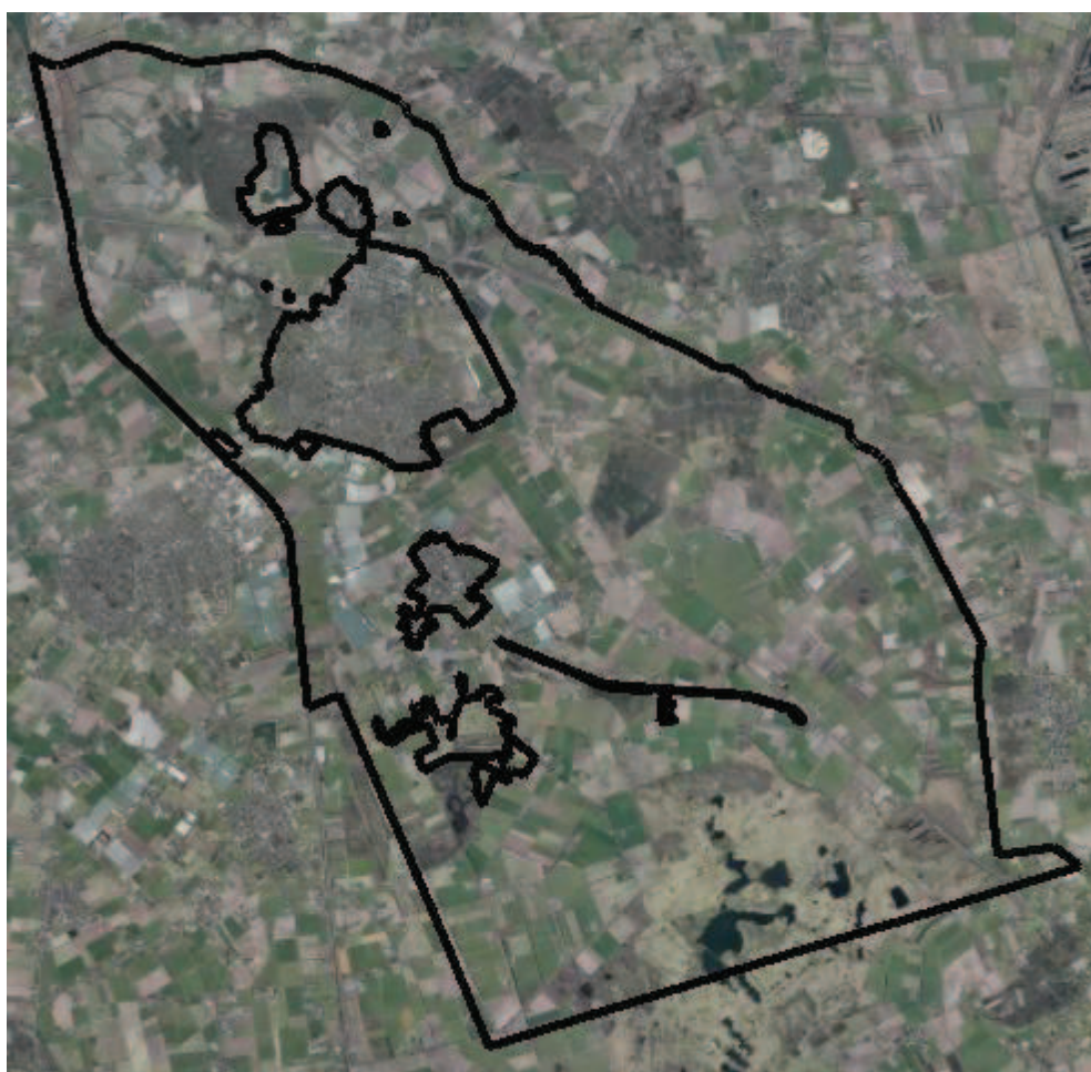
Figuur 2.1 Begrenzing plangebied

Het plangebied omvat het gehele buitengebied van de gemeente Asten, uitgezonderd de kernen Asten, Heusden en Ommel en het recreatiepark Prinsenmeer in Ommel. De plangrenzen worden gevormd door de gemeentegrens en de grenzen van de bestemmingsplannen voor de woonkernen/bedrijventerreinen en de beheersverordening voor genoemd recreatiepark. Figuur 2.1 geeft een overzicht van de begrenzing van het plangebied.