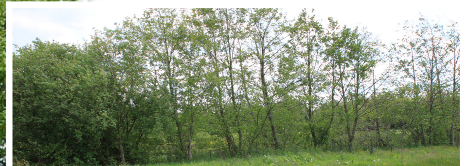
bomen op erfgrans