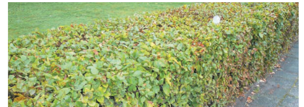
knip / scheerhaag