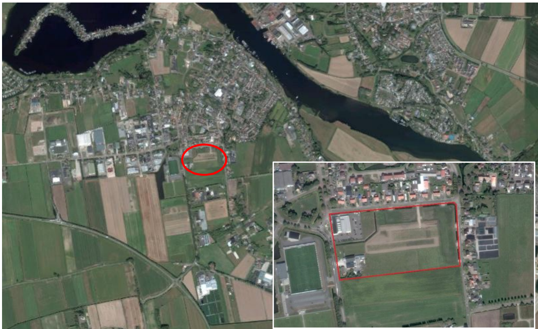
Figuur 1. Ligging plangebied (rood omlind).

Het plangebied is circa 42.000 m 2 groot en ligt aan de zuidzijde van Veen, gemeente Aalburg, zoals te zien in figuur 1. De locatie wordt aan de noordzijde begrensd door de Nieuwstraat en aan de oostzijde door de Rivelstraat. Verder wordt de zuidzijde van het plangebied begrensd door agrarisch gebied en aan de westzijde door de achterkant van een autoschadeherstelbedrijf en koopcentrum met bijbehorend parkeerterrein aan de Groeneweg.