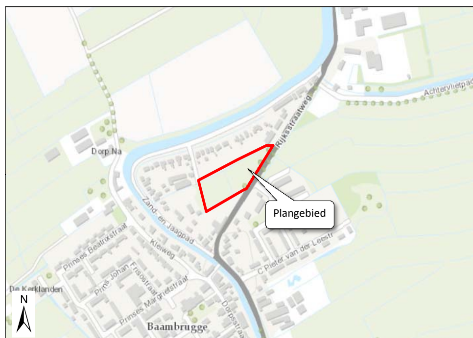
Figuur 1. Ligging van Plangebied Kromwijck.

In de bebouwde kom van Baambrugge zijn enkele graslanden aanwezig. De graslanden zijn omsloten door bebouwing en wegen. Een gedeelte van de graslanden is op dit moment in gebruik als weidegebied voor paarden.