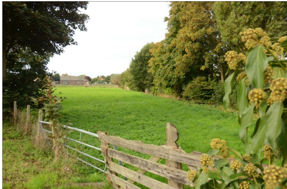
Een veldindruk van de huidige situatie in plangebied Kromwijck te Baambrugge.

Op verzoek van de opdrachtgever is aansluitend aan de quicksan tevens een visonderzoek uitgevoerd. Hiermee kan direct uitsluitsel worden verkregen omtrent mogelijk aanwezige juridisch zwaarder beschermde vissoorten (met name Kleine modderkruiper en Bittervoorn). Alle wateren van het plangebied zijn hierbij bemonsterd door ze met een elektrisch visapparaat af te vissen.