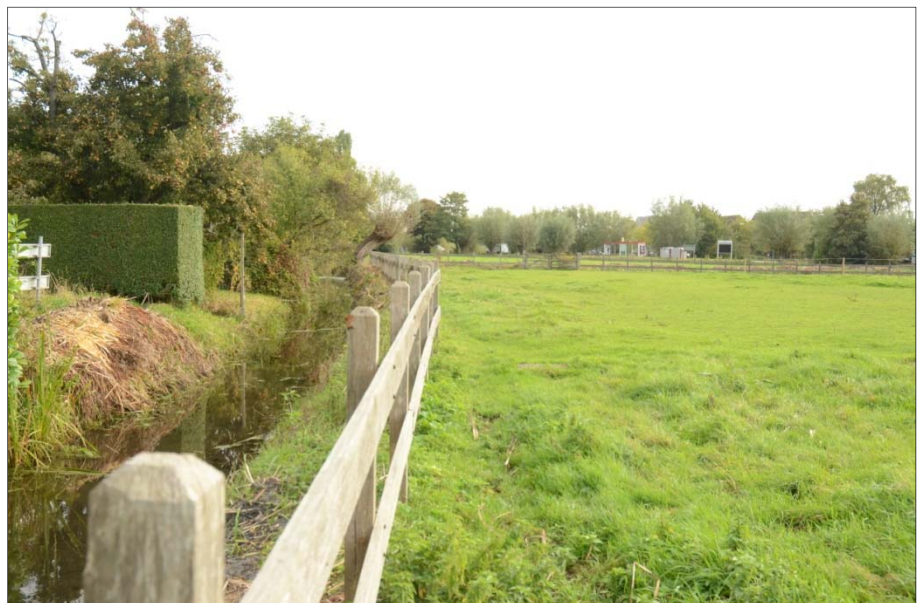
Aan de buitenzijde van de gebiedsgrens zijn diverse heesters en bomen aanwezig in particuliere tuinen.

Rond het plangebied zijn diverse sloten aanwezig. Het betreft afvoersloten van enkele meters breed met lokaal veel slib op een ondergrond van klei. Langs de waterlijn zijn planten als Egelskop,