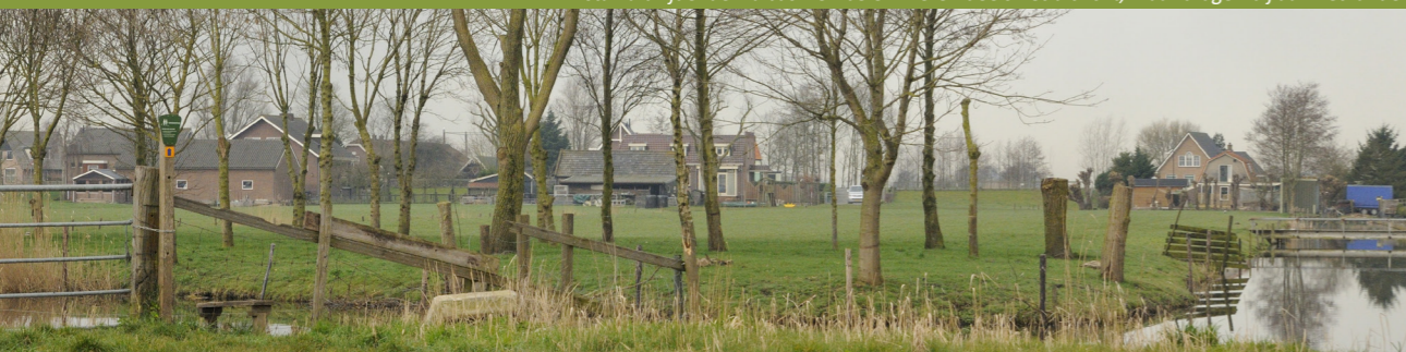
Zicht op het Bovenland vanuit de polder.