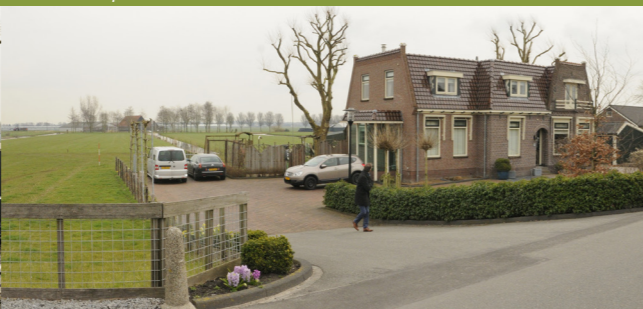
Nieuwe inrit kan beter landschappelijk worden ingericht door streekeigen landschapselementen zoals een knip- of scheerheg.