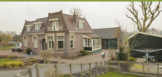
Door de oprit en de bijgebouwen te verwijderen, komt de woning weer aan het landschap te liggen.