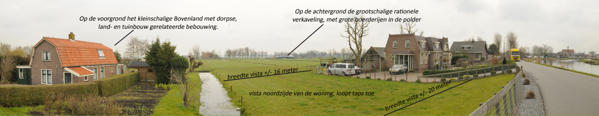
Op de voorgrond het kleinschalige Bovenland met dorpse, land- en tuinbouw gerelateerde bebouwing.