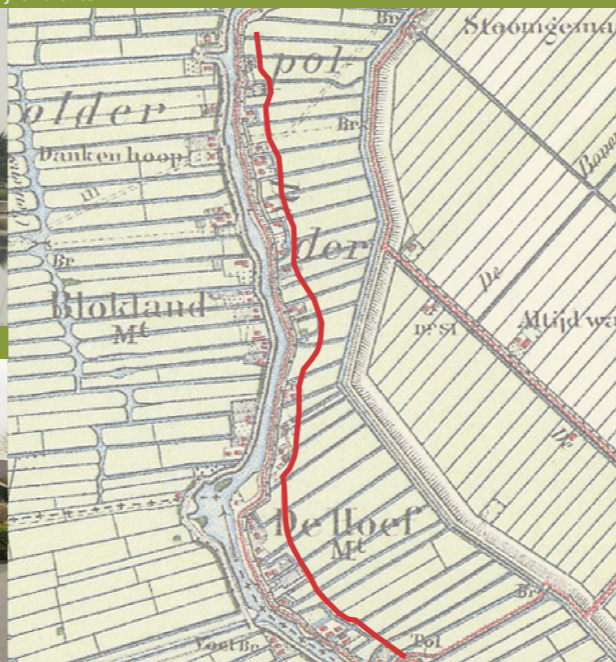
Positie van de nieuwe schuur wordt onder andere bepaald door de achterrooilijn van de historische lintbebouwing.