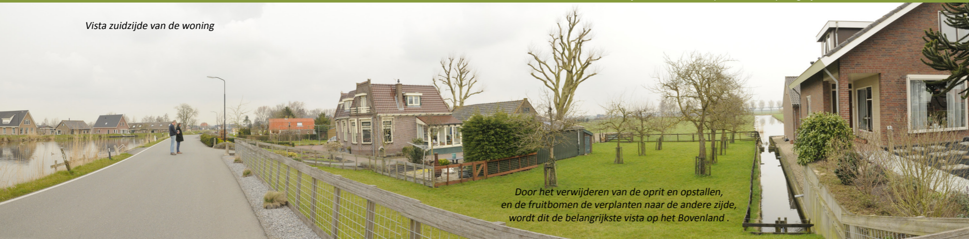
Vista zuidzijde van de woning

Door het verwijderen van de oprit en opstallen, en de fruitbomen te verplanten naar de andere zijde, wordt dit de belangrijkste vista op het Bovenland.