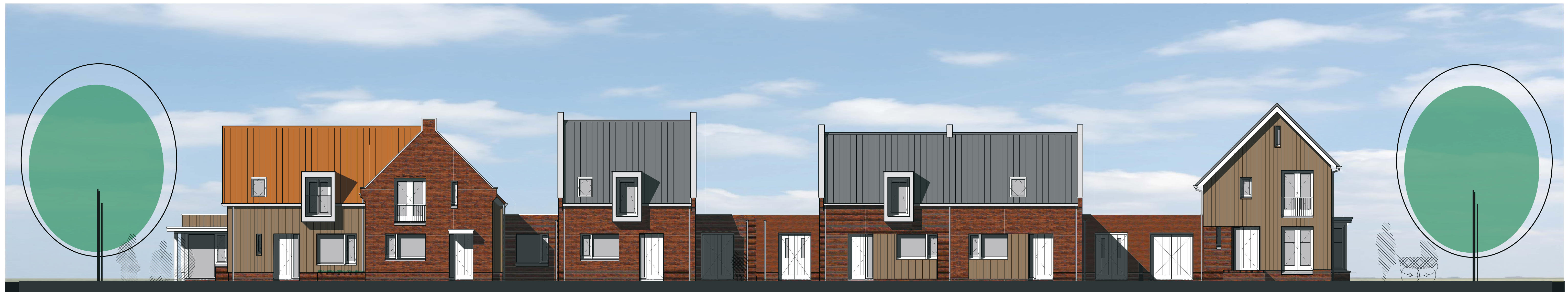
straatbeeld Bessendreef (noord)