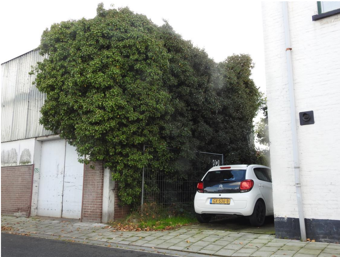
Foto 2. Zuidzijde van het gebouw.