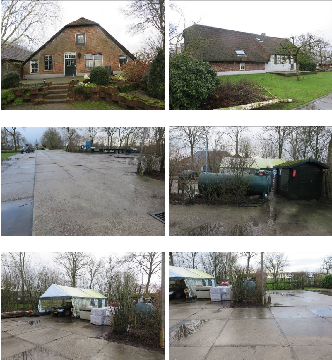
Vervolg figuur 2. Foto-impresie van de Hei- en Boeicopseweg 19 te Hei- en Boeicop.