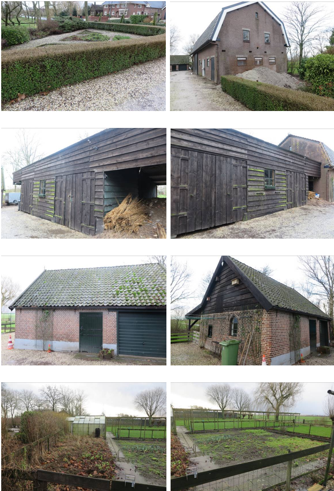
Figuur 2. Foto-impressie van de Hei- en Boeicopseweg 19 te Hei- en Boeicop.