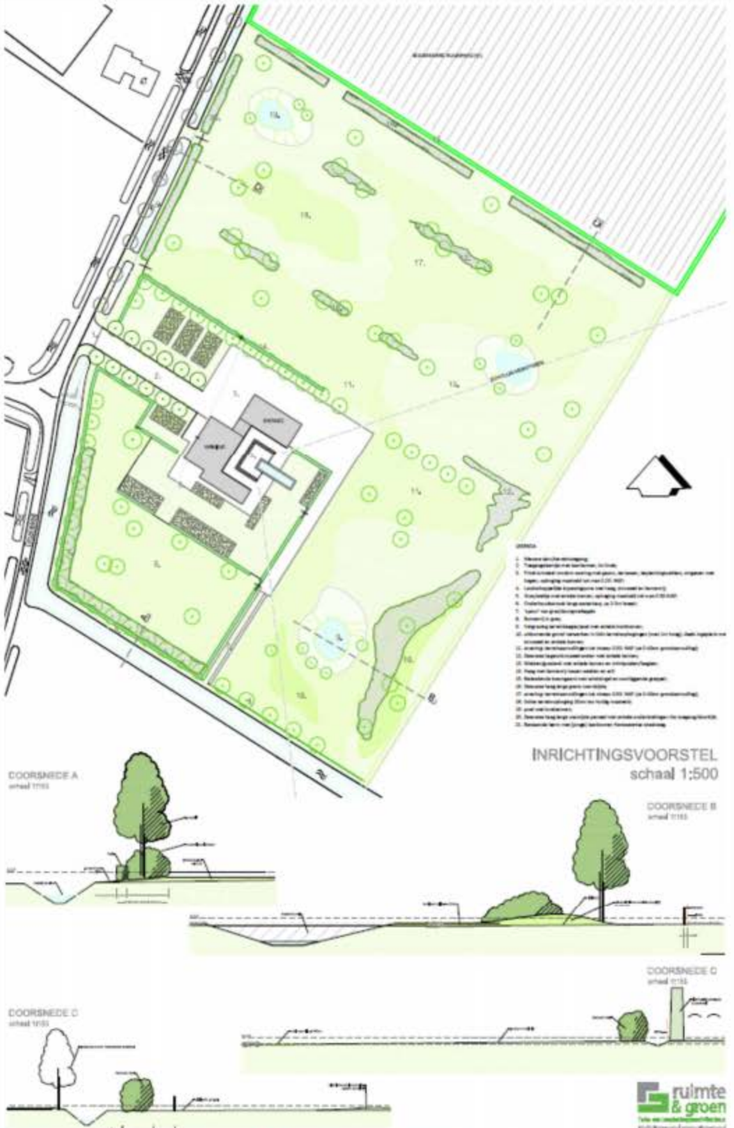
Figuur 5: Indicatieve inrichting woonperceel en landschappelijke inpassing

In ruimtelijke onderbouwing Hansweertsestraatweg 4 (bijlage bij Toelichting BG 2019)