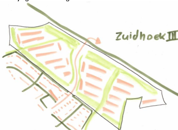
Afb. 1. Impressie initiatief

In het plangebied van Zuidhoek 3 zijn maximaal 140 woningen voorzien. Met het fietspad van de spoortunnel tot aan Jip en Janneke wordt het gebied opgedeeld in een oostelijk en een westelijk gebied. In beide gebieden is een dorps woonmilieu voorzien in een mix van vrijstaande woningen, tweekappers, geschakelde- en rijwoningen. Ieder gebied heeft een straat met eenzijdige bebouwing die het gebied omsluit en een of meerdere binnenstraten met tweezijdige bebouwing.