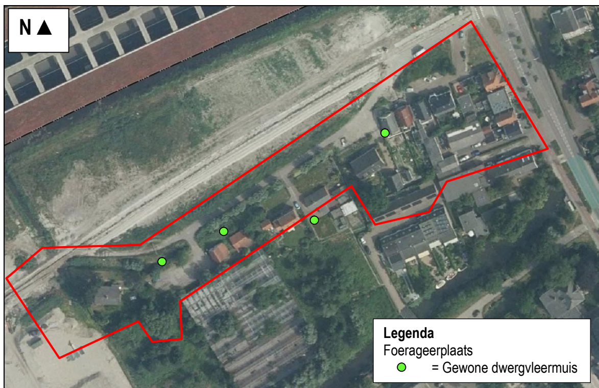
Figuur 2. Waarnemingen van vleermuizen in de voorzomer in het gebied Santhorst te Zoeterwoude.

In de voorzomer is één soort vleermuis waargenomen (gewone dwergvleermuis). Deze soort is enkel (in lage dichtheid) foeragerend aangetroffen. Er zijn geen kolonies of vliegroutes aangetroffen. In figuur 2 zijn de waarnemingen weergegeven.