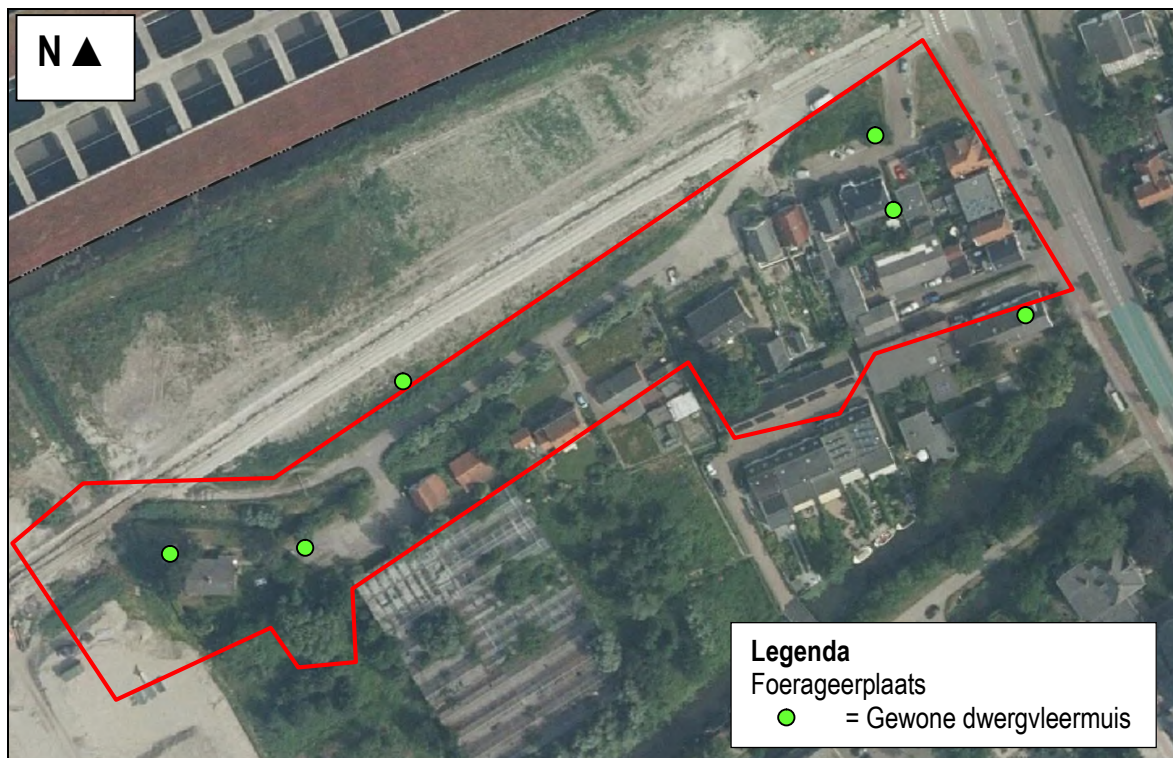
Figuur 3. Waarnemingen van vleermuizen in de voorherfst in het gebied Santhorst te Zoeterwoude.

Gelet op de aantallen en dichtheid van de foeragerende vleermuizen dient het plangebied van Santhorst te Zoeterwoude niet gezien te worden als belangrijk (primair) foerageergebied.