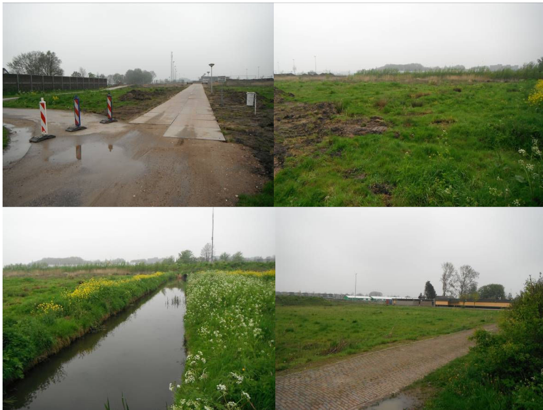
Figuur 2: Foto's van het plangebied.