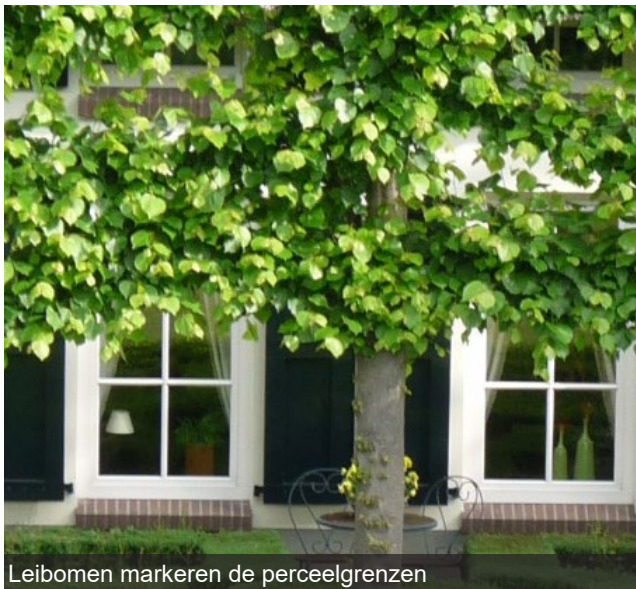
Leibomen markeren de perceelgrenzen