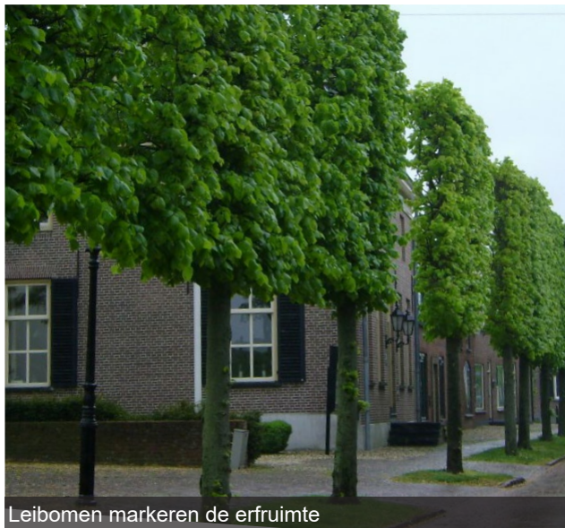
Leibomen markeren de erfruimte