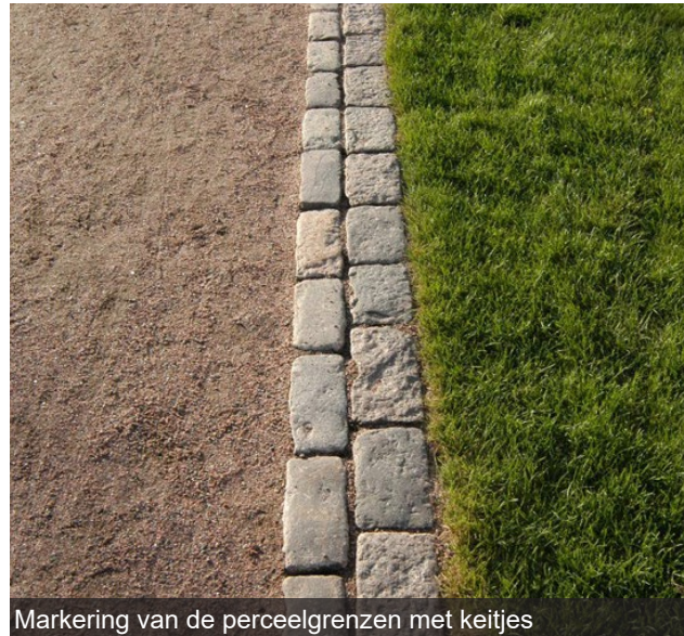
Markering van de perceelgrenzen met keitjes

Doordat het mogelijk is om achter de leibomen te parkeren wordt het parkeren zoveel mogelijk