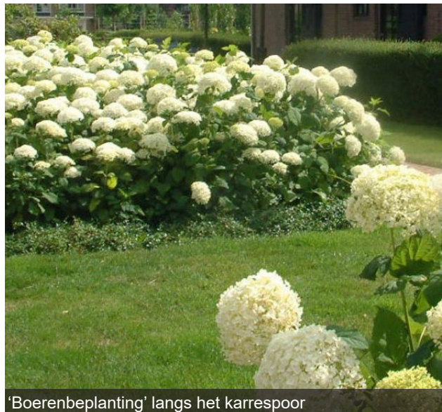
'Boerenbeplanting' langs het karrespoor