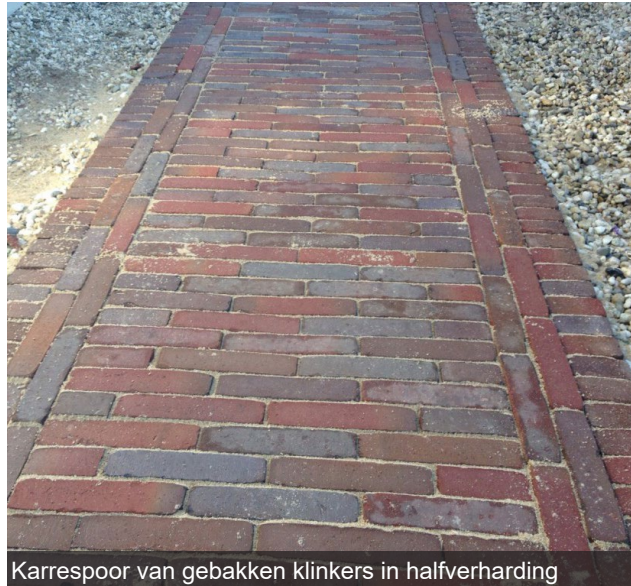
Karrespoor van gebakken klinkers in halfverharding