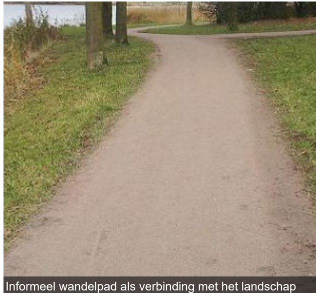
Informeel wandelpad als verbinding met het landschap