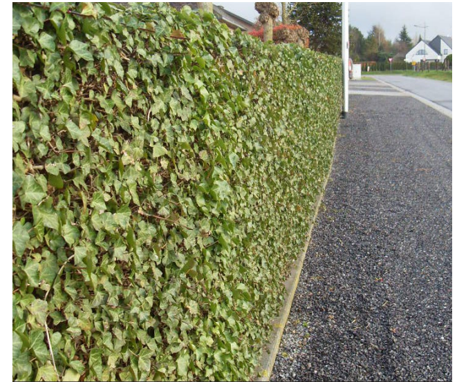
Mobilane haag als groene erfafscheiding aan de achterzijde