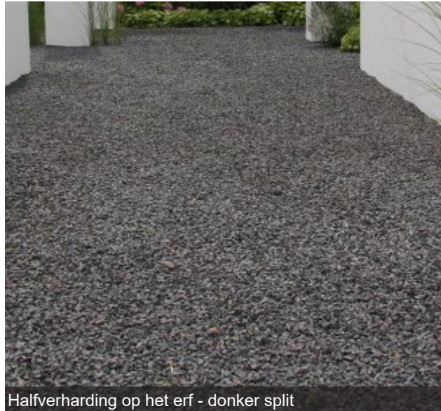
Halfverharding op het erf - donker split

Het karrespoor bestaat uit een strook van klinkerbestrating in een halfverharding van basaltsplit. De halfverharding van basaltsplit verbindt alle onderdelen van het erf met elkaar en creëert een rustig en eenvoudig beeld. Aan de westzijde van het karrespoor liggen, in de grasberm en tussen de laanbomen, enkele parkeerplaatsen van grasbetontegels. Aan de oostzijde van het karrespoor wordt de berm ingeplant met boerenbeplanting. Tussen de laanbomen liggen de opritten naar de woningen.