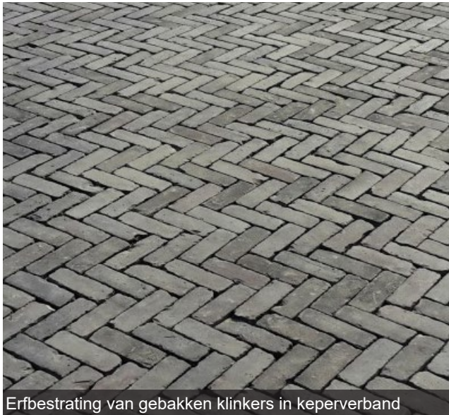
Erfbestrating van gebakken klinkers in keperverband