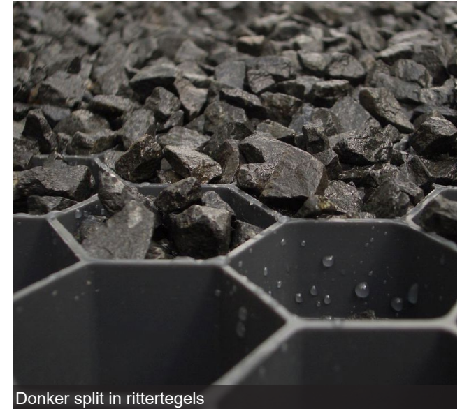
Donker split in rittertegels