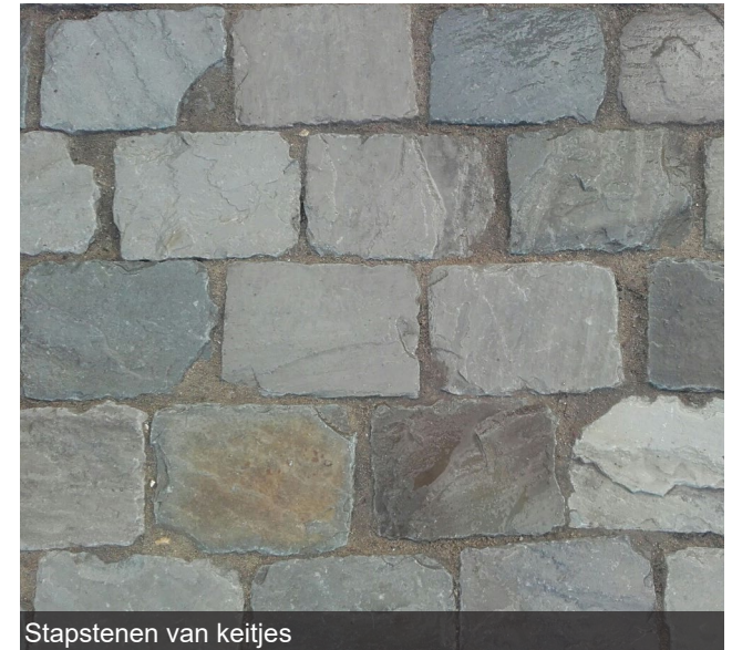
Stapstenen van keitjes