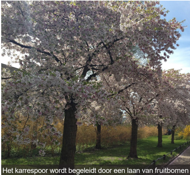
Het karrespoor wordt begeleidt door een laan van fruitbomen