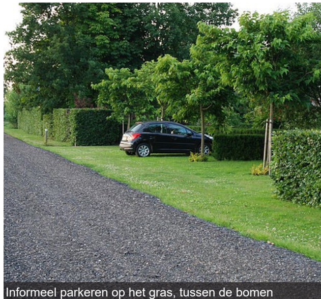
Informeel parkeren op het gras, tussen de bomen