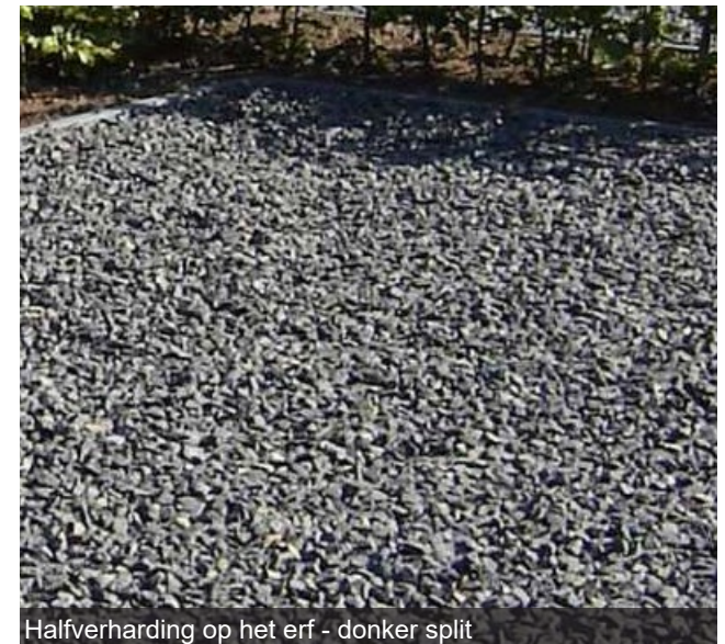
Halfverharding op het erf - donker split