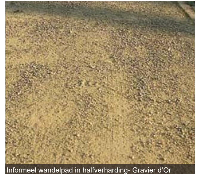
Informeel wandelpad in halfverharding- Gravier d'Or