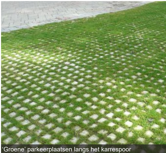
'Groene' parkeerplaatsen langs het karrespoor