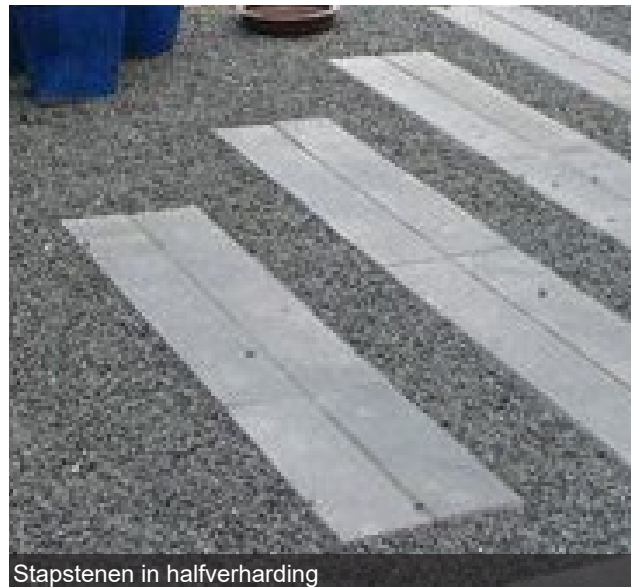
Stapstenen in halfverharding