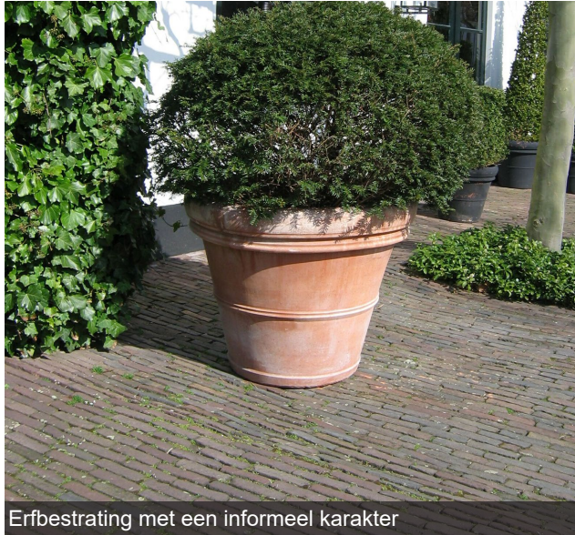
Erfbestrating met een informeel karakter