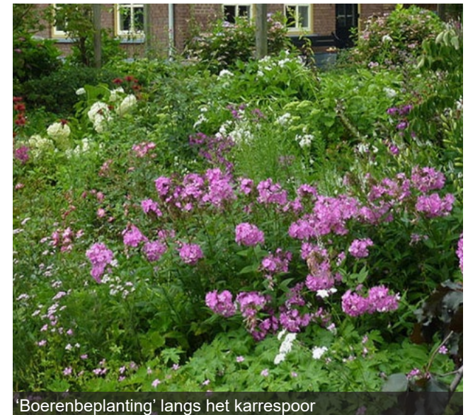
'Boerenbeplanting' langs het karrespoor