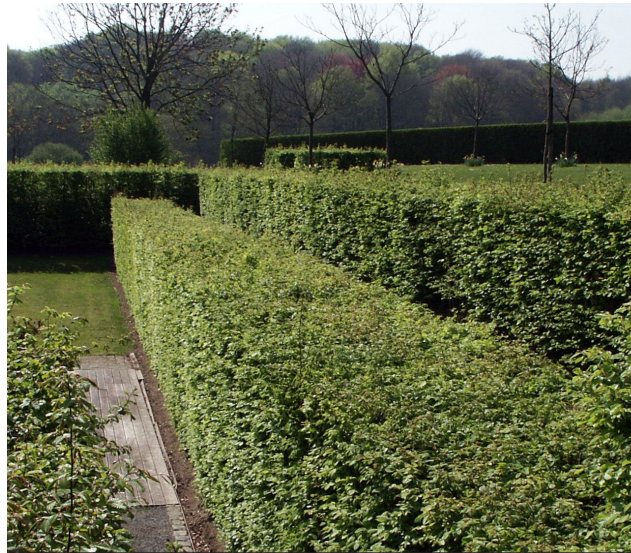
Ligusterhagen als erfafscheiding met een landelijk karakter

Aan de oost- en westzijde sluit het erf aan op het netwerk van informele wandelpaden uit de omgeving. De paden bestaan uit een eenvoudige halfverharding en lopen aan beide zijden tot op het centrale erf. Het verbrede deel van het erf verbindt de paden met elkaar. Hiermee maakt het erf daadwerkelijk deel uit van de route en wordt het opgenomen in zijn omgeving.