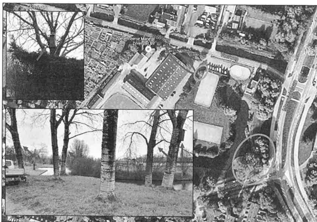
Figuur 8: Bomen waar de nestkasten voor de Huismus zijn opgehangen (blauw omcirkeld) ten opzichte van de locatie van de huidige verblijfplaatsen (rood omlijnd)