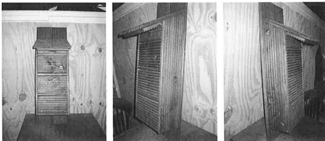
Figuur 7: Type nestkasten die aangeboden zijn als tijdelijke verblijfplaats

Omdat er binnen het plangebied tien verblijfplaatsen van de Huismus aanwezig zijn, en in iedere huismussenkast vier verblijfplaatsen aanwezig zijn, zijn vijf van bovenstaande kasten opgehangen.