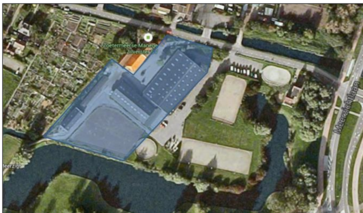
Figuur 2: Begrenzing van het plangebied (blauw gearceerd)