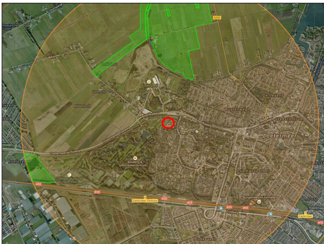
Figuur 3: Ligging van het plangebied (rood omcirkeld) t.o.v. EHS-gebieden (groen gearceerd)

Het plangebied maakt geen deel uit van de Ecologische Hoofdstructuur (EHS) (figuur 3). Omdat er, als gevolg van de voorgenomen plannen, geen oppervlakte aan EHS-gebied verloren gaat, is er geen toetsing aan de wet- en regelgeving omtrent de EHS nodig.