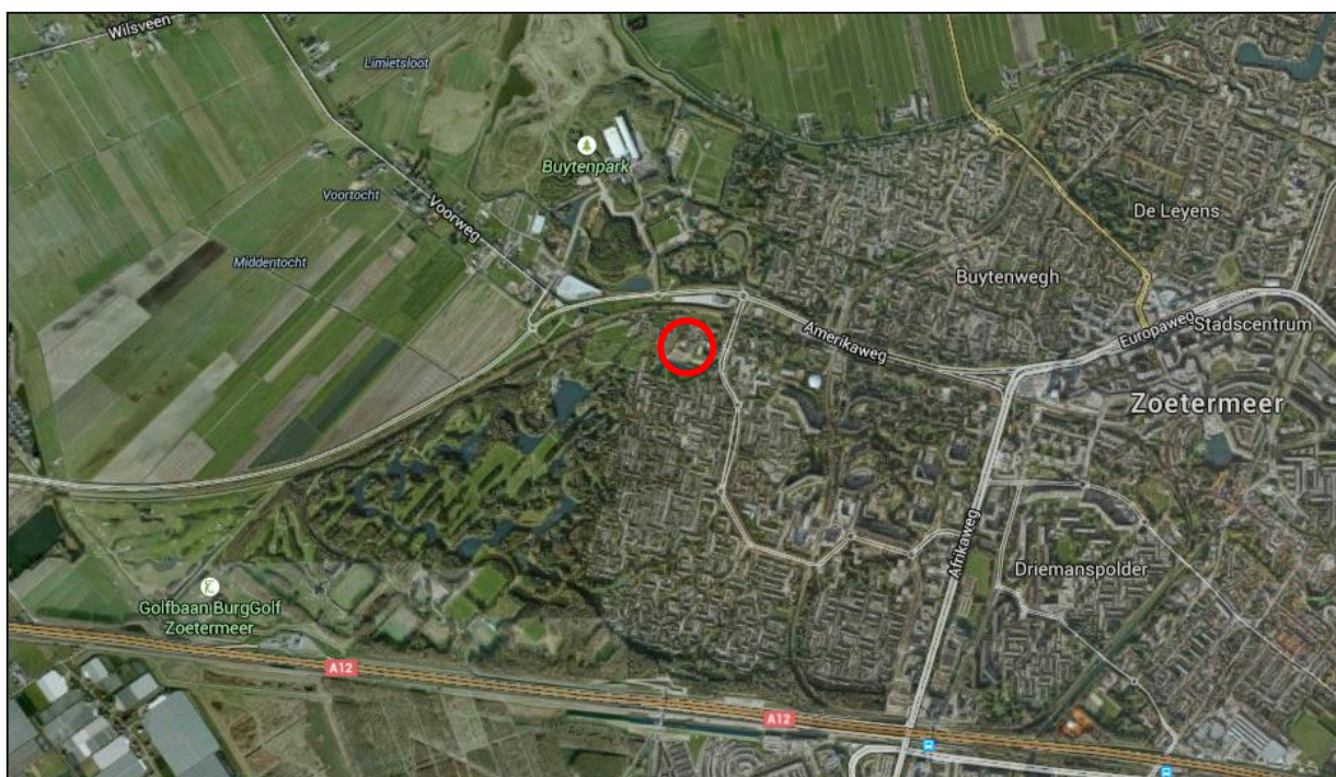
Figuur 1: Ligging van het plangebied (rood omcirkeld) in de omgeving