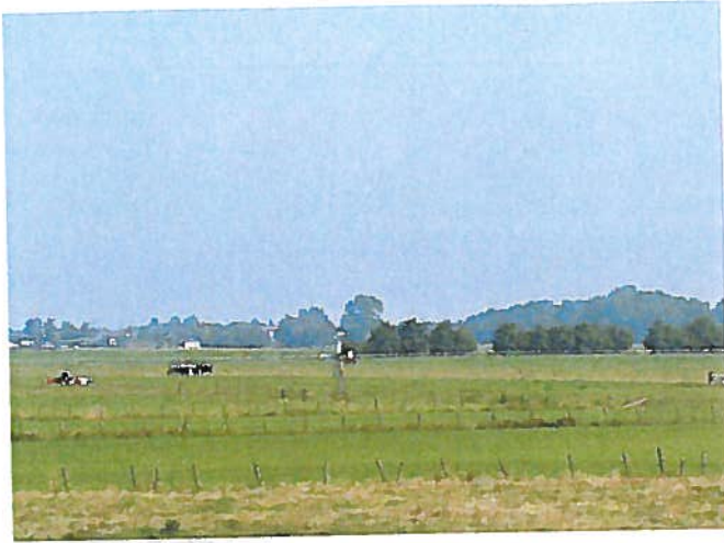
Een weidemolentje in de Meerpolder

De Middelweg die midden door de polder loopt, werd in 1616 in gebruik genomen als 'rijweg naar Leyden'. In 1780 kregen het Zoetermeerse dorpsbestuur en het polderbestuur van de Meerpolder toestemming om tol te heffen voor het onderhoud van de weg. De tol was gevestigd aan de Stompwijkse kant en heeft tot 1826 bestaan.