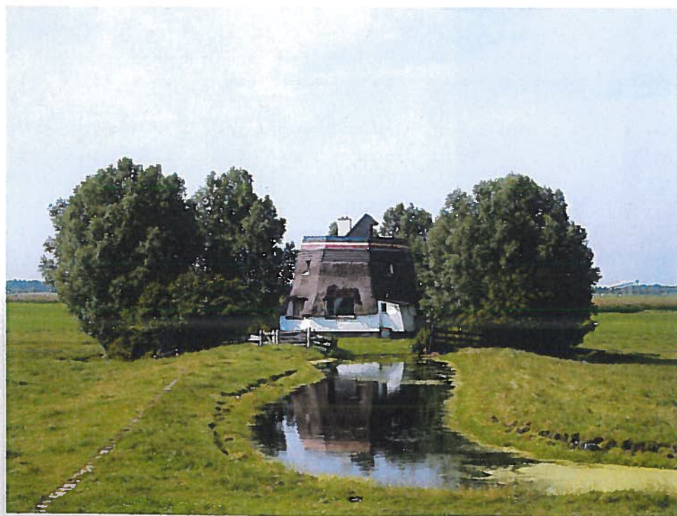
Eén van de afgetopte molens

De bebouwing in de Meerpolder is zeer schaars. Van oudsher staan er boerderijen tegen de ringdijk aan met hun kap haaks op de richting. Deze zijn uitgebreid met nieuwe stallen, silo's, kassen en hekwerken. Ook zijn er woonhuizen bij gebouwd. De functie van de drie molens is overgenomen door een electrisch gemaal. De molens zijn nog aanwezig, maar zij zijn afgetopt en doen nu dienst als woonhuis. De relatie met de polder is daardoor minder herkenbaar geworden.