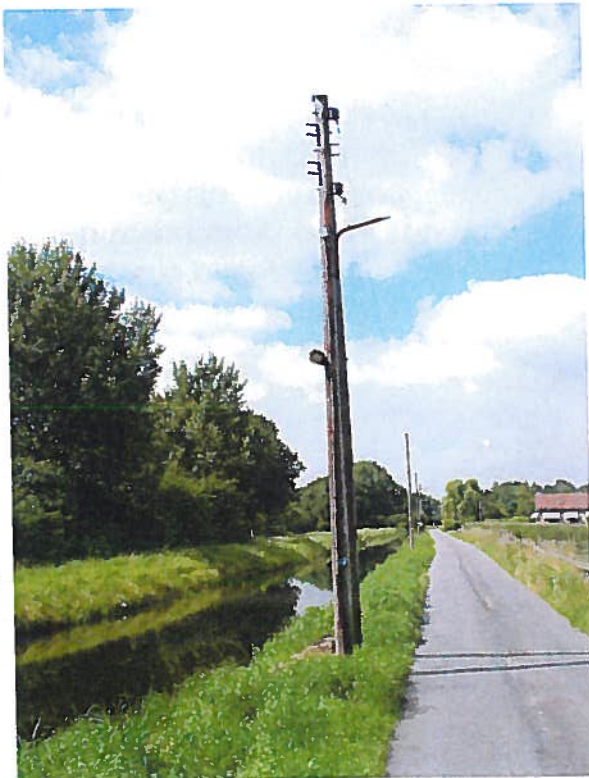
Houten telefoonpalen langs de ringdijk

De afgetopte molens als herinnering aan de historische polderbemaling.