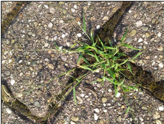
Klein liefdegras Eragrostis minor