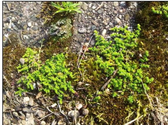
Kaal breukkruid Herniaria glabra .