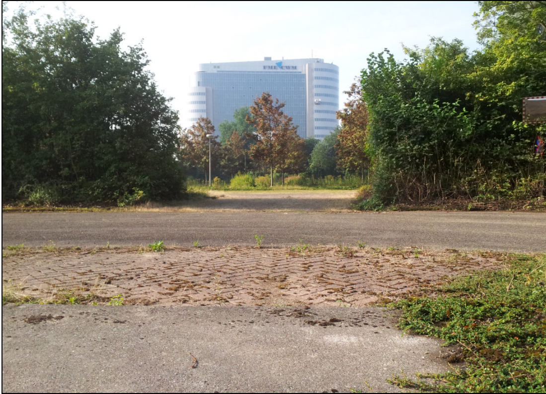
Impressie voormalig parkeerterrein IBM