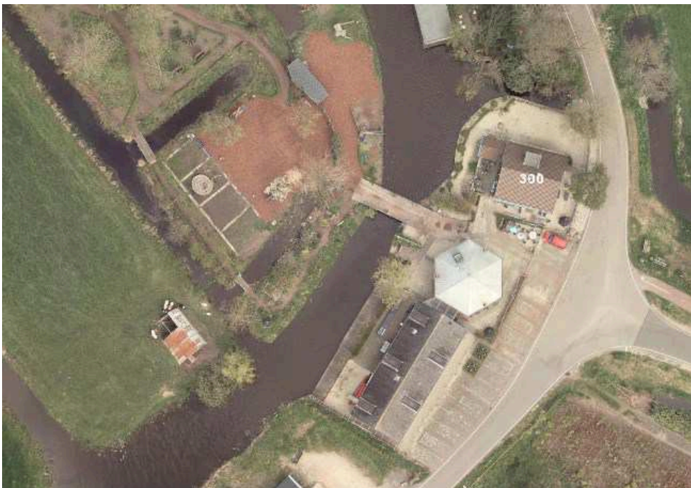
Feitelijke situatie perceel Meije 300. Luchtfoto google per oktober 2016

Team Ruimtelijke Plannen 18 oktober 2016