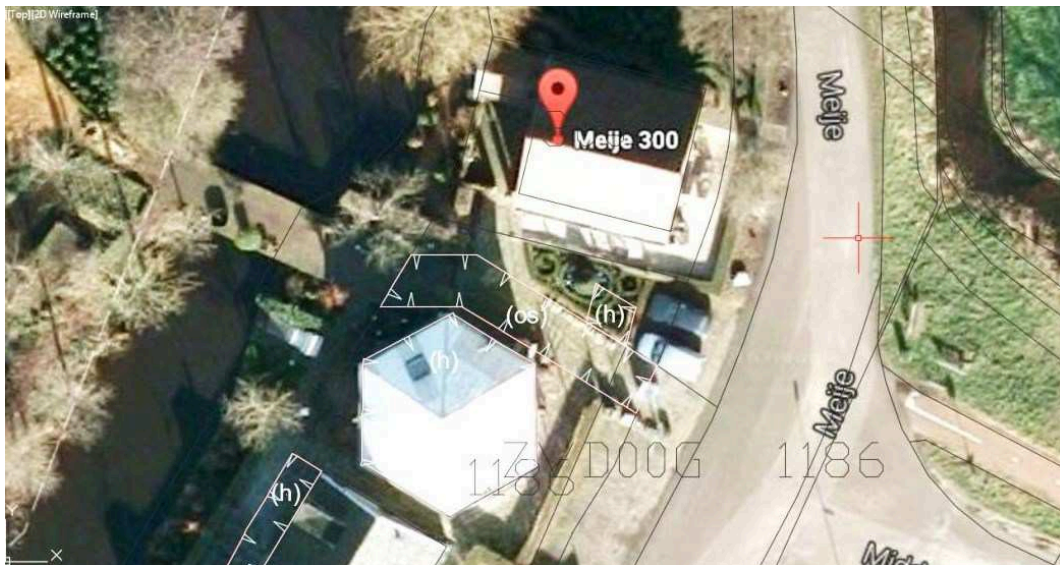
(screenshot oktober 2016 met omkaderd de feitelijke situering van terras en ontsluiting)