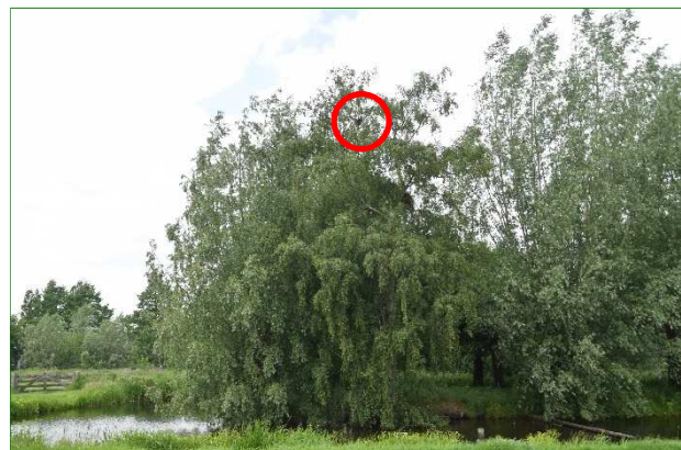
Het nest in de Berk vanaf het grasland gezien.