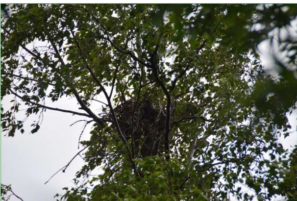
Het nest in de berk van onderaf gezien.