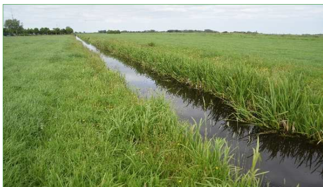
Een deel van de bemonsterde sloot.

In het genomen monster is de Platte schijfhoren aangetroffen. Dit monster ligt in of direct naast het plangebied. Vanwege de steekproefsgewijze bemonstering wordt de gehele randsloot als geschikt leefgebied beoordeeld waarin de Plate schijfhoren met lage dichtheden voorkomt.